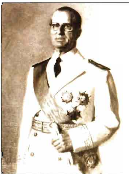
Cirilo Cánovas García, Ministro de Agricultura (1957-65)

Los estragos de la guerra civil española y el aislamiento al que estuvo sometido nuestro país, tras la segunda conflagración mundial, habían determinado una situación de penuria para la agricultura española durante los años anteriores a 1964.