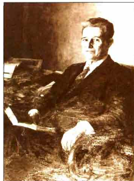
Adolfo Díaz-Ambrona, Ministro de Agricultura desde 1965 a 1969

Coexistían, en España, los latifundios absentistas con los minifundios ineficaces y exasperantes. Tanto unos como otros eran nidos de pobreza. Los latifundios porque generaban grandes bolsas de paro real, los minifundios porque encubrían, bajo