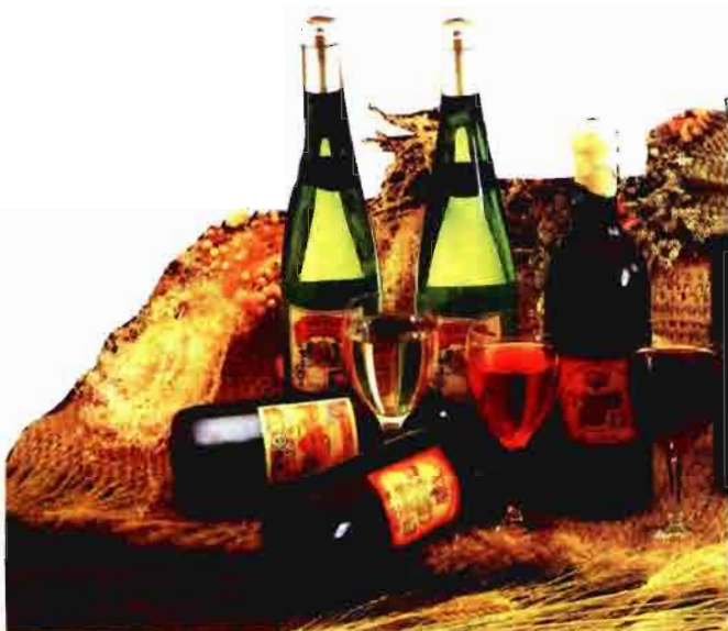
Vinos de Castilla y León