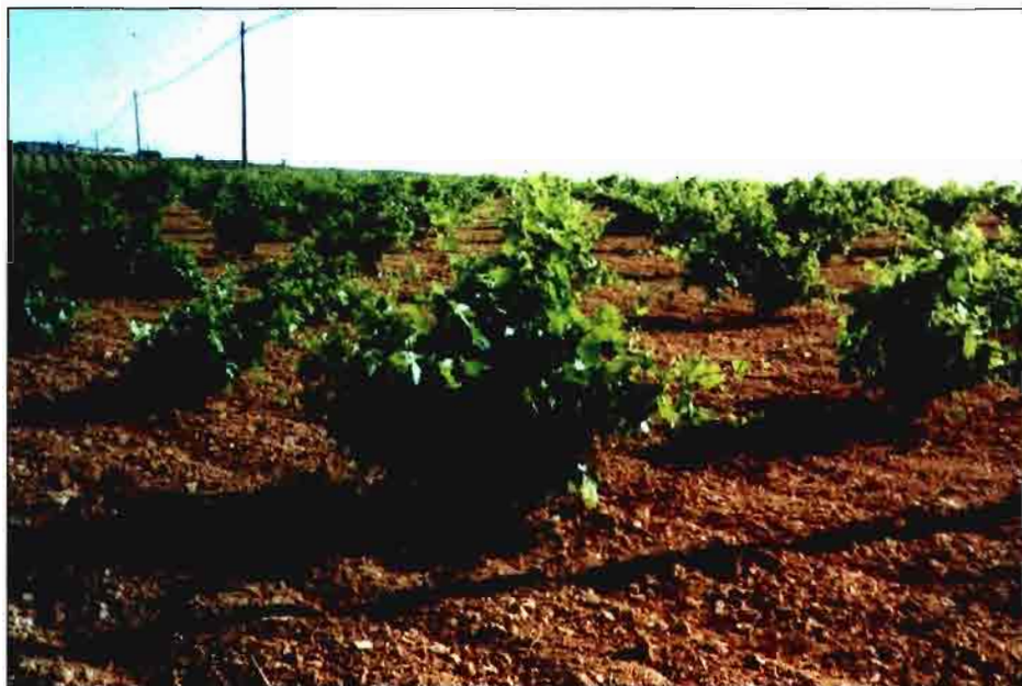
Daimiel. Ciudad Real

La normativa actual en la U.E está desarrollada en 21 Reglamentos, y por claridad, sencillez y transparencia se considerada adecuado sustituirlos por