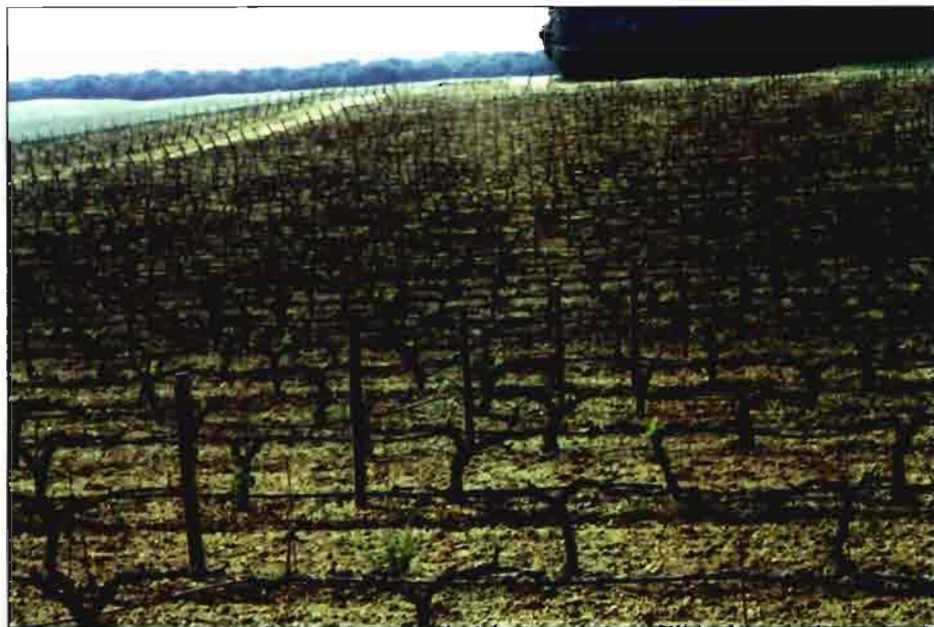
Viñedo en espaldera. Finca la Ventosilla. D.O. "Ribera del Duero"

La superficie de viñedo de nuestra Región en el año 1985 era de 88.300 ha, habiendo descendido el año 1987 a 76.600 ha, lo cual ha supuesto un descenso de 18.300 ha y 6.600 ha respectivamente con relación a la superficie actual, que como hemos dicho es de casi 70.000 ha.