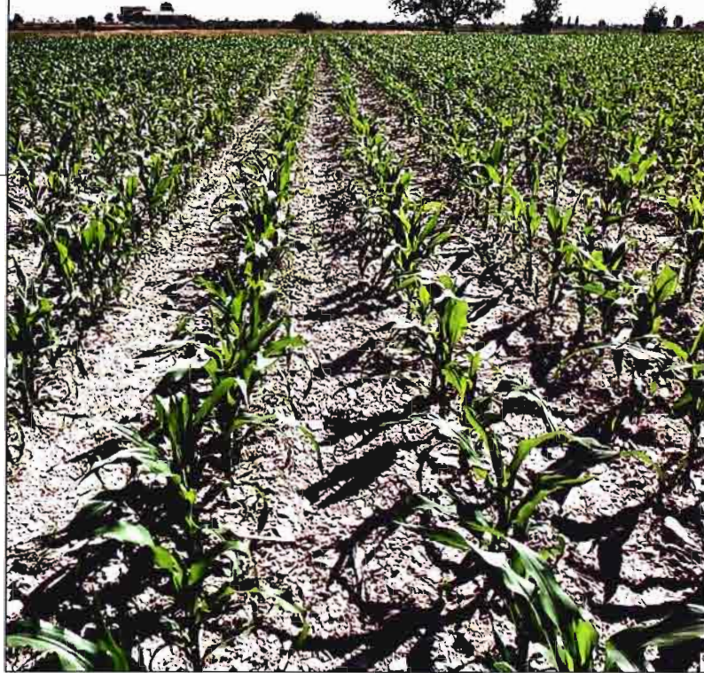
Campo más limpio de malas hierbas por la acción eficaz de un insecticida