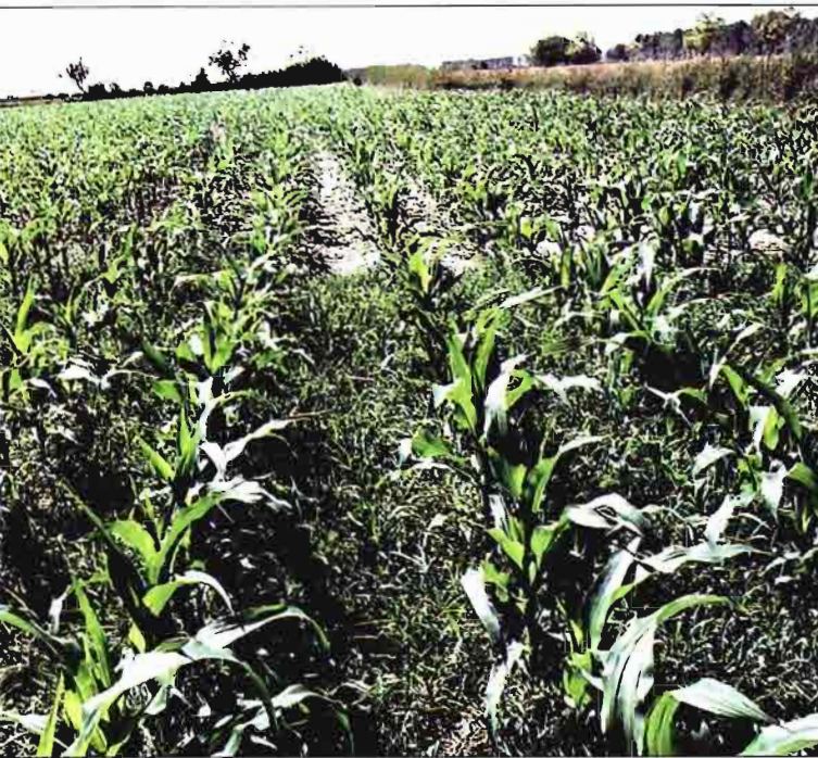
Ensayos de hierbas en maíz