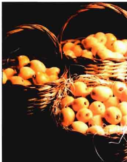
Nísperos "Callosa d'en Sarriá", producidos en la comarca de la Marina Baixa, al nordeste de la provincia de Alicante, en las cuencas de los ríos Algar y Guadalest. Son productos con Denominación de Origen.

Afortunadamente el propio tratado de Roma, uno de cuyos objetivos fundamenta-