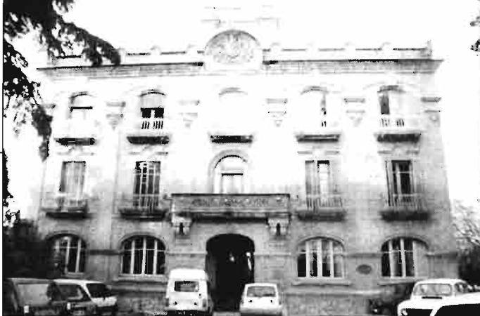
Edificio donde se encuentra ubicada la sede del Panel de Cata de Aceites Virgenes de Oliva de Cataluña, en Reus (Tarragona).