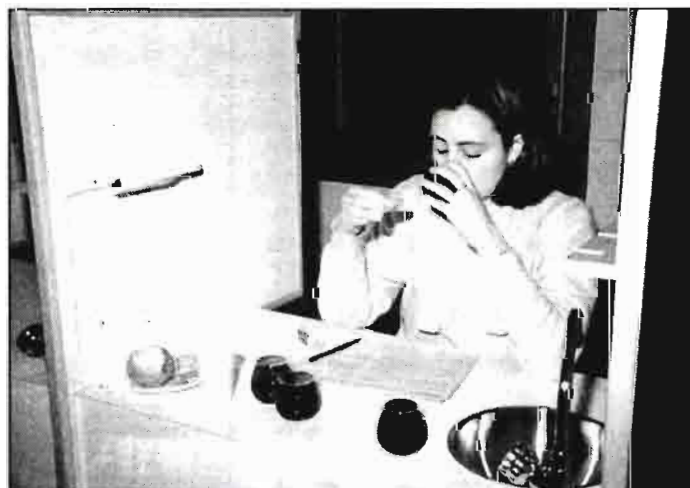
Sesión comercial de cata de aceites. Detalle de la disposición de copas, hoja de perfil, agua y manzana, en una cabina normalizada de la Sala de cata del Panel de Cataluña.