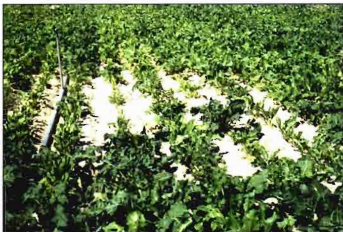
Cultivo de remolacha afectado por Heterodera schachtii

El 76% de las tierras productoras de remolacha azucarera están infectadas de Heterodera schachtii