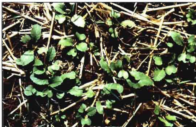
Emergencia de plantas de Pegletta sobre rastrojo