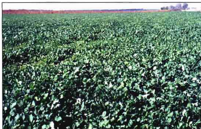
Cultivo de Pegletta

La climatología influye enormemente en la evolución de los quistes. Los años lluviosos y calurosos propician el desarrollo de la plaga