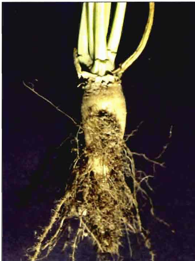
Nemátodo de quiste en remolacha

El 76% de las tierras productoras de remolacha azucarera están infectadas de Heterodera schachtii