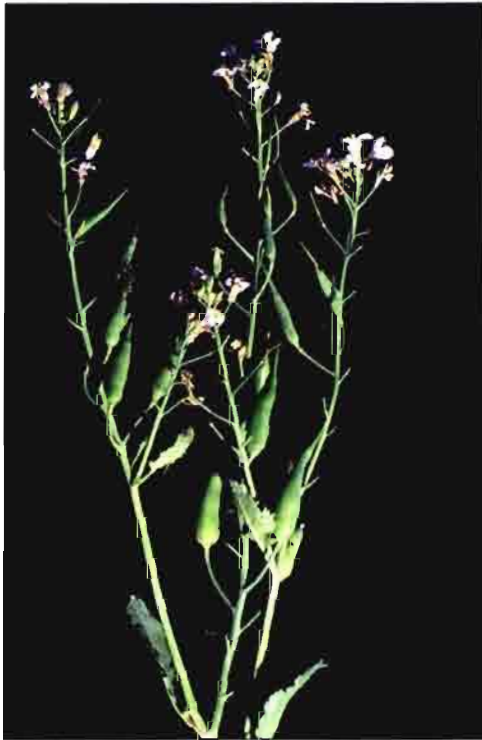
Planta de Pegletta

Estas plantas realmente no matan a los nemátodos, por lo que el nombre de nematocida no es muy feliz. Tampoco lo es el de