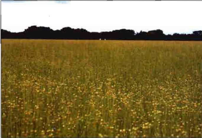
Campo de lino