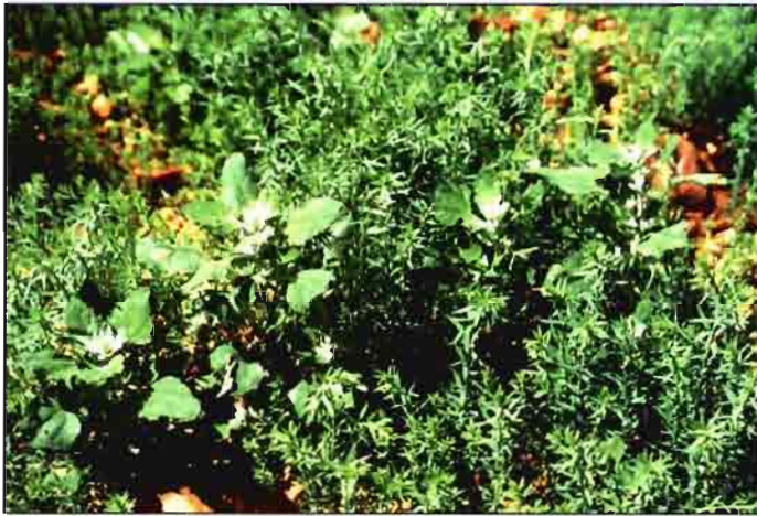
Chenopodium album en cultivo de lino

Conviene adelantar los tratamientos de postemergencia