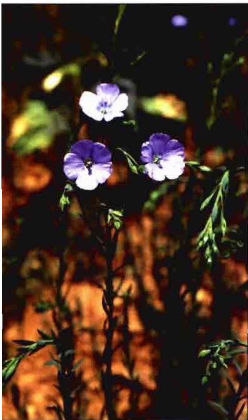
Planta de lino en flor