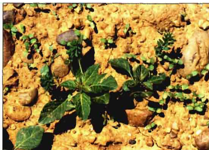
Invasión de Datura stramonium en lino