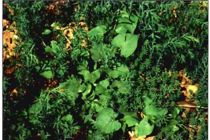
Bilderdykia convolvulus en campo de lino