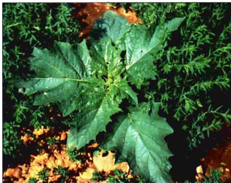
Hierbas de Amaranthus hybridus