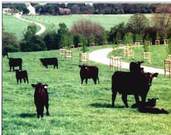
La ganadería vacuna extensiva inglesa, salpicada de cruces de todo tipo, trata de recuperar la pureza de las razas, como es el caso del intento actual, en las fincas JCB Wootton, con el ganado Aberdeen Angus.

El rebaño de Polwarth es una experiencia con objeto de producir lana fina en el país. La raza Polwarth tiene tres cuartos de Merino y un cuarto de Lincoln Longwool. La raza, conseguida en Australia hace 100 años es conocida como "Ideal" en América del Sur. La lana obtenida oscila entre 19 a 23 micras.