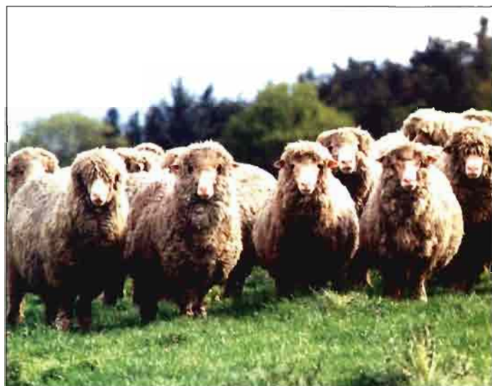
Los ingleses, para incrementar la producción de lana fina, están intentando la adaptación del Merino español, extendido como se sabe en el Hemisferio Sur (Australia, Nueva Zelanda, Sur-Africa) o bien sus cruces, como es el caso de la raza Polwarth, de la foto, tomada en la finca Wootton Lodge, propiedad de la firma de maquinaria JCB, en la raya de los condados de Stafford y Derby.