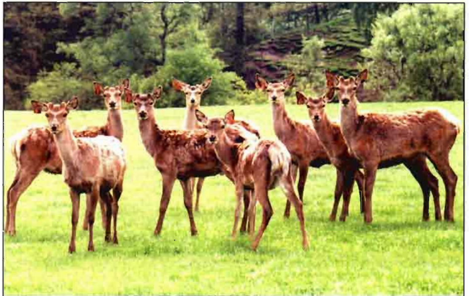
Maravillosa estampa de un grupo de ciervas rojas del rebaño de 900 cabezas que se explotan en la finca propiedad de la firma JCB, y que tienen a su disposición exuberantes praderas para pastorear, en un entorno de bosques y zonas paisajísticas recientemente embellecidas.

JCB Wootton Farms Ltd representa la explotación agraria de la compañía JC Bamford Excavators Ltd, fabricante de grandes máquinas de obra civil y de los tractores marca "Fastrac".