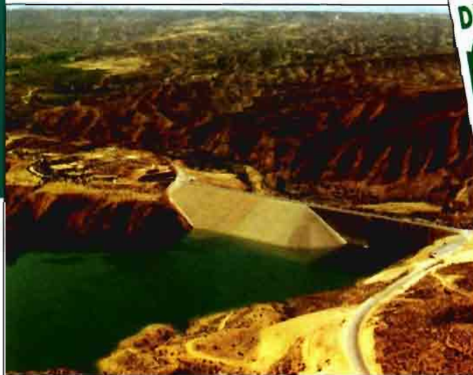
Presa del Negratín (Granada).

Adecuar la superficie regable a la disponibilidad de agua