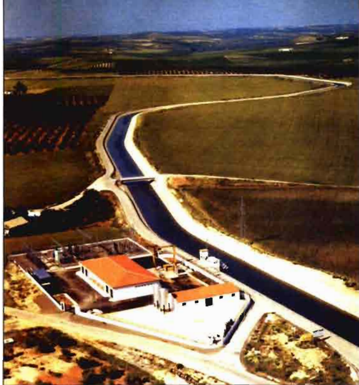
Canal de riego del Genil - (Cambra).

En la Cuenca del Guadalquivir, el techo del regadío se cifra en 500.000 has