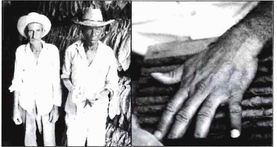
Campeños de la Vuelta Abajo, el Valle del Tabaco.

• Se desarrolló una agricultura altamente consumidora de recursos importados y