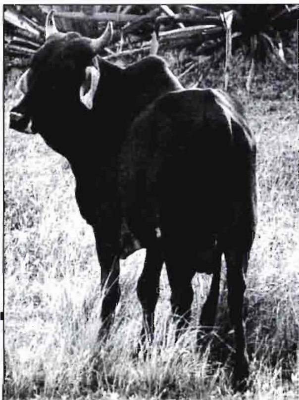
Vaca zebú pastando en un campo de piñas.

Asimismo, la presencia del sector estatal y de las UBPC, que debía tender a bajar los precios al incrementar la oferta, es aún muy escasa, ya que aún no obtienen los resultados necesarios en términos productivos, debido a lo cual cuando concurren lo hacen también con altos precios, pues ante la baja producción, necesitan cubrir los subsidios que hasta ahora han estado recibiendo y ya no recibirán más.