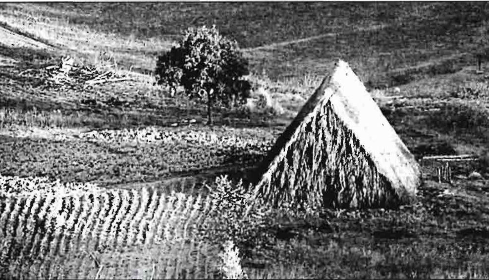
Plantación y secadero de tabaco.

Por otra parte, es conocido que la demanda de alimentos, como artículos de primera necesidad, es poco elástica a los precios, es decir, la población tendrá que seguir comprando los alimentos que necesita para vivir independientemente de que sus precios sean altos y, como existe demanda, los vendedores no bajan los precios.