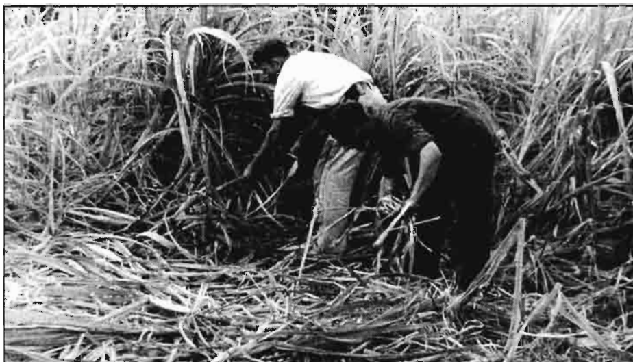
La recolección de la Caña dulce. Expertos segadores especializados cortan las cañas con fuertes guadaí o con hachas.

- La producción de azúcar dispuso en esos tres años de un 15-20% de los fertilizantes que consumía normalmente, y el país en general ha estado consumiendo alrededor de un 23% de su consumo pro-