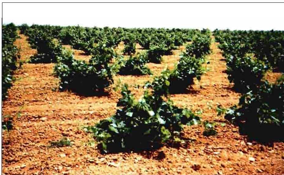
Viña en Villarrobledo (Albacete)

Las denominaciones Almansa, Jumilla y Méntrida, que son zonas naturales, se extienden cada una sobre dos provincias limítrofes, con superficies respectivamente en las provincias de Valencia, Murcia y Madrid.