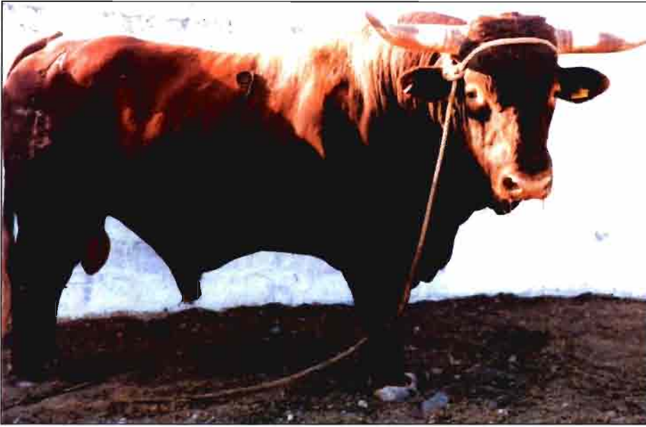
Toro mejorado de la raza Retinta inscrito en el libro Genealógico.

tanto del pastizal como del ramón suministrado por el arbolado, compuesto principalmente por encinas ( Quercus ilex L. ) y alcornoques ( Quercus suber L. ).