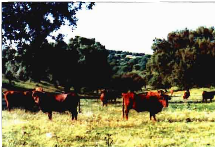
Vacunos Retintos en su lugar de origen, al suroeste español.

acumulada reserva todo poder definidor de grupo, raza o tipo.