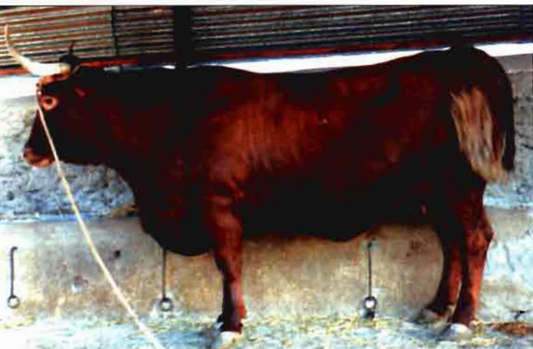
Magnífico ejemplar de vaca retinta en el que se pueden apreciar las características morfológicas de la raza.