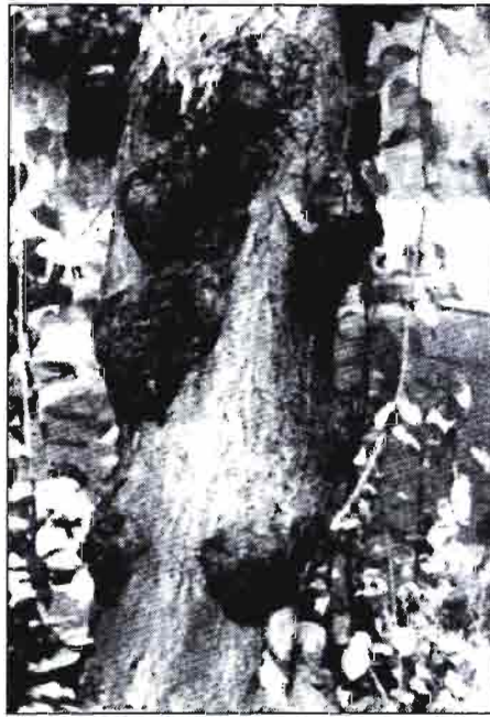
Daño de chancro en un cerezo de la calle Trafalgar.

d) Participación de la Comunidad Vecinal. Se debe animar a los vecinos de la co-