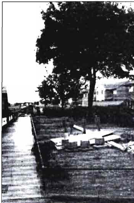
Los trabajos en el subsuelo perjudican a los árboles notoriamente.

Las campañas de colaboración vecinal, muy interesantes para repoblaciones urbanas