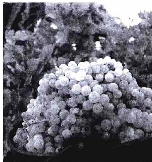
C.R.D.O. "La Mancha".

En cualquier caso la cosecha es sumamente corta y los cálculos presentados por nuestro país en Bruselas (con base la mencionada estimación de octubre, de 20,45 millones de Hl producidos) quedan de esta forma: