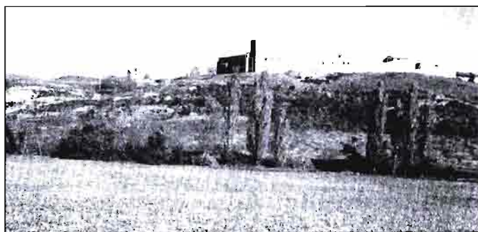
Campo de ensayos de variedades de guisante en Navarra.