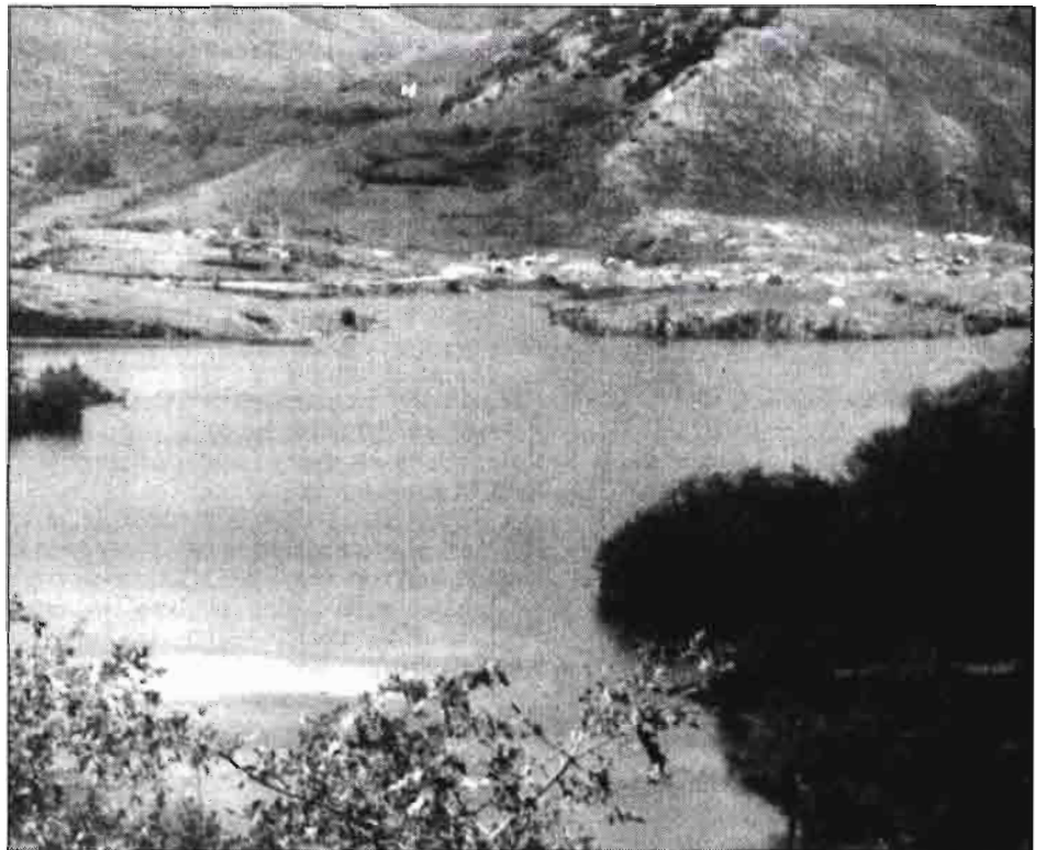
Reserva Nacional de Fuentes Carrionas. (Palencia).

a) Aumento y mejora de barbechos a fin de extensificar la producción y mejorar la estructura y fertilidad natural de los suelos.