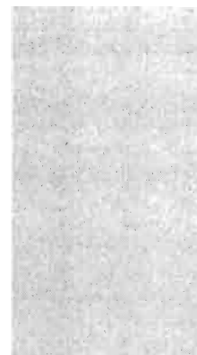
Cuadro Nº 1

En leguminosas pienso hay que destacar la marcha que llevan las importaciones de guisantes forrajeros canadienses de los cuales se han importado unas 170.000 toneladas en los primeros ocho meses de campaña (desde el 1 de Julio hasta principios de Marzo). En total se han superado, para el conjunto de procedencias, las 206.000 Tm (67.000 más que en el mismo período de la pasada campaña). De habas, en cambio, sólo se importaron 33.000 toneladas (— 17.000).