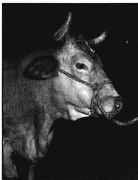
Silleda'93. Rubia Gallega.

Las almendras comunes han bajado en origen hasta las 570 pta/kg grano, las largueiras hasta las 590 y las marconas hasta las 640. Las avellanas negretas consiguen 660 pta/kg grano y las corrientes 650. Por primera vez en lo que llevamos de campaña los precios de las avellanas superan a los de las almendras.