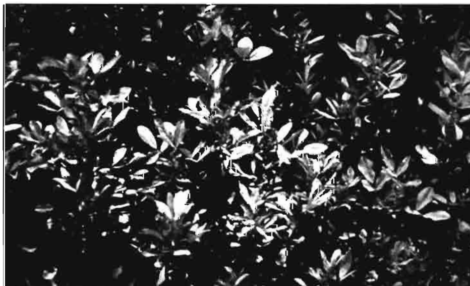
Alfalfa (Publicación de Pioneer 1989).

En el cuadro nº 4 se detallan, por provincias, las producciones de algodón bruto obtenidas durante el último año. Ofrecen pocas variaciones respecto a cifras anteriormente publicadas.