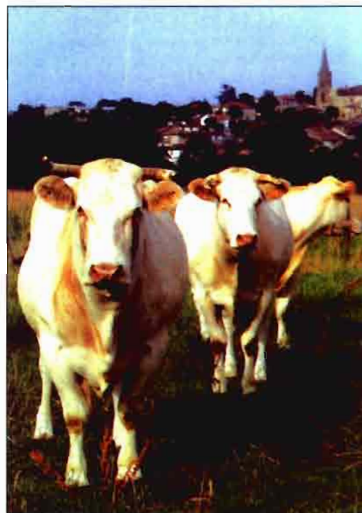
Cuadro Nº 12

Para la campaña 1994/95 todavía no hay propuesta de reducción de cuotas, pero se baja que ésta podría quedar entre un 1% y un 2%. La Comisión está preocupada al comprobar el creciente contenido graso de la leche producida y por ello ( ver cuadro nº 1 ) propone un recorte del 5% en el precio de intervención de la mantequilla, manteniendo el de la leche en polvo.