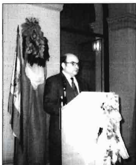
En la foto, Vicente Albero, Ministro de Agricultura, en la entrega de los premios "Alimentos de España".

Estos precios así como los del lino y las primas del tabaco figuran en el cuadro nº 1 . Para esta denostada solanácea se reduce el cupo comunitario de 370.000 a 350.000 toneladas, conforme estaba previsto en la reforma de la PAC; podría admitirse una cierta reestructuración varietal.