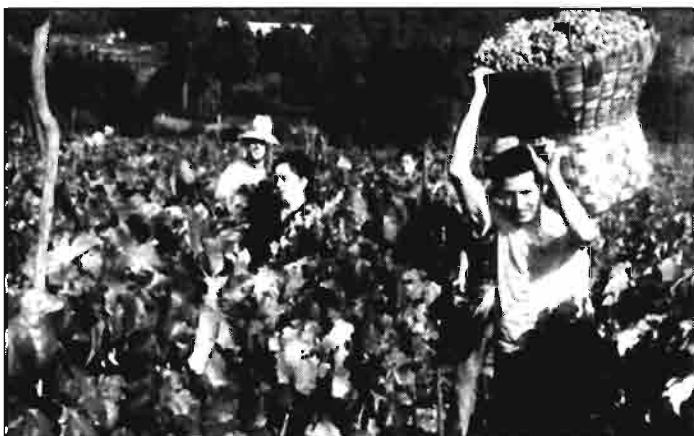
De "Vinos de Extremadura"