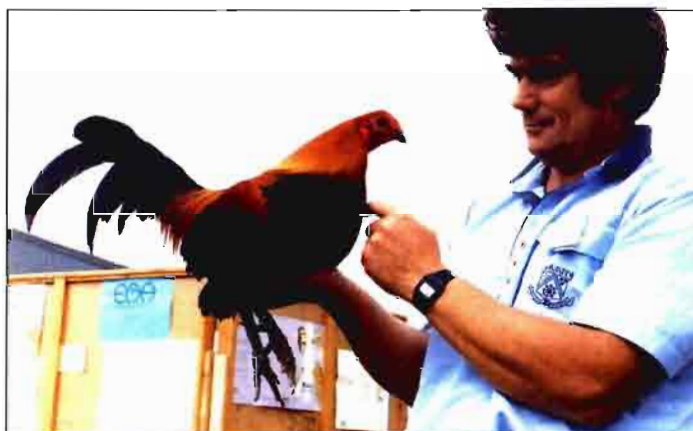
Campeón de las aves de corral en la Real Feria Agropecuaria.