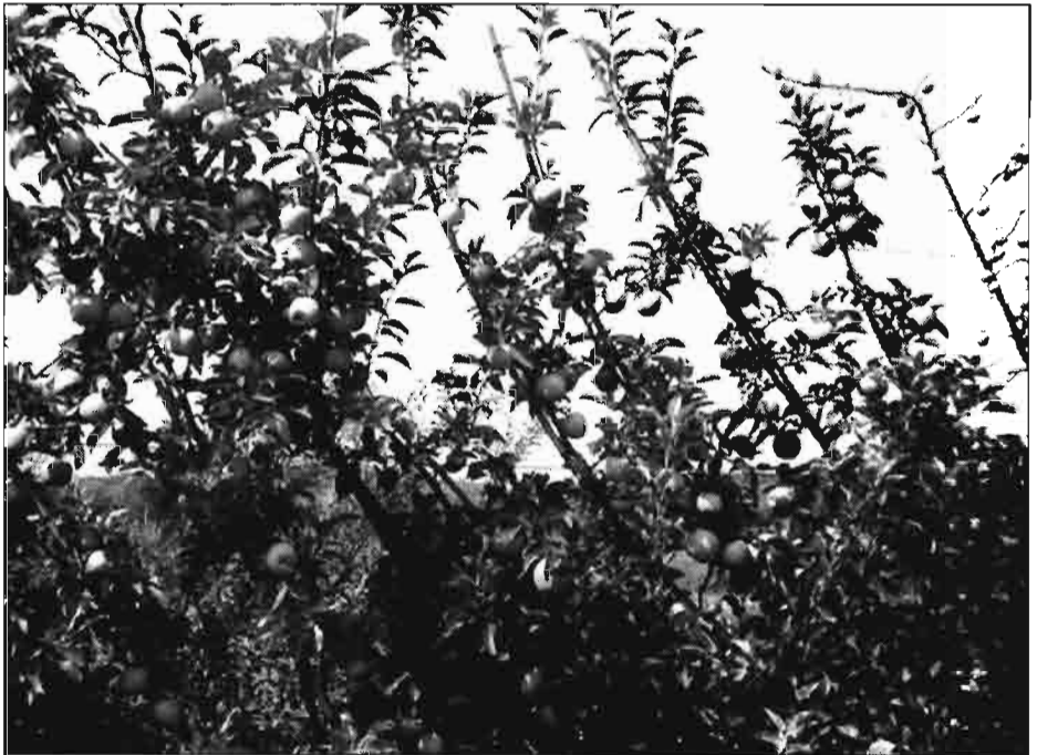
Plantación experimental en manzanos. Campos de ensayo de la Escuela T.S. Ingenieros Agro-

Uvas de mesa Ohanes a 32 ptas/kg en Murcia y Aledo a 55 en Alicante, ambos productos sobre cepa.