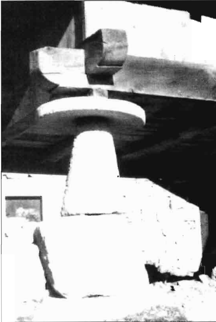
Valle de Ancares. León. El "Diezmo del Hierro" al Obis- pado de Astorga se pagaba ya en el año 1172.

cado un Decreto que regula y ordena las industrias artesanales.