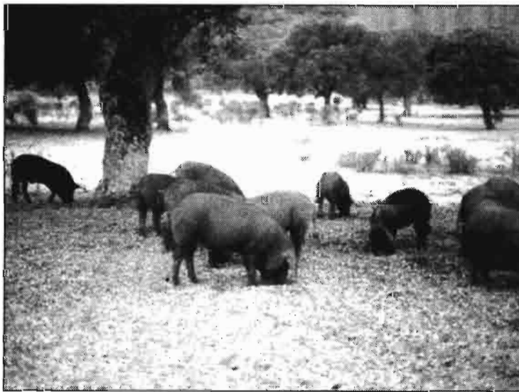
Del Folleto "Jamón de Guijuelo" cuna del jamón ibérico.

La industria agroalimentaria adquiere cada día mayor importancia por la demanda que sobre ella hay como consecuencia de la modificación de los hábitos de consumo en una sociedad cada día más industrializada, así como por la incorporación de la mujer al mundo laboral, principalmente.