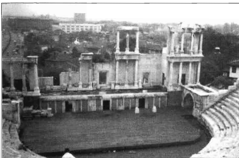
Ruinas romanas en Plovdiv.

Al parecer, esta tendencia regresiva está cambiando últimamente: en el sector privado la producción de algunos productos ganaderos está aumentando, por ejemplo en un 25,7% en leche. La participación de dicho sector en la producción final agraria se cifra en un 40%, según el Instituto Central de Esta-