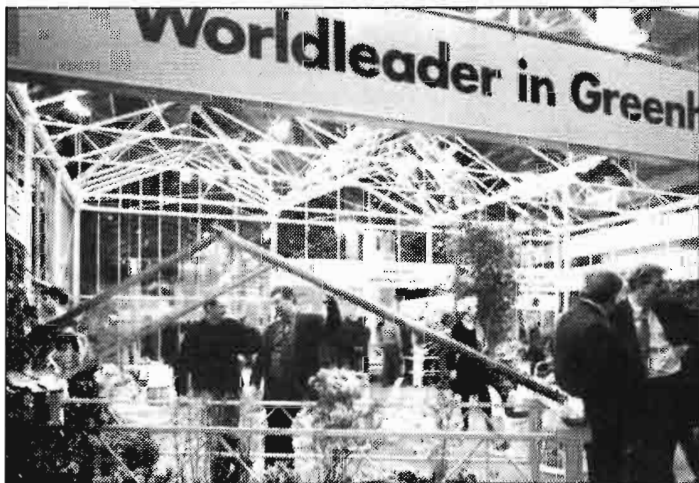
El cultivo en invernaderos es la base del sector hortícola holandés. En la foto, stand de Entex Hassen en la NTV. Esta empresa holandesa está especializada en la construcción y mantenimiento de invernaderos.