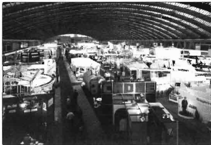
Aspecto que ofrecía el Randstadhal del centro de Exposiciones de la RAI, el pasado mes de Enero con motivo de la NTV 93.