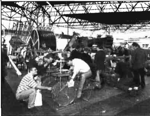
Visitantes de la NTV, en el Salón Hollandhal, interesados en la nueva maquinaria de plantación que ofrecía la casa POTVEER.