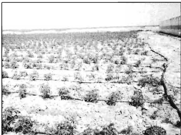
Riego por goteo en una plantación de tomates en Tierra de Marisma en proceso de desalinización. Al fondo, La Marisma en estado natural. Foto Cortesía de Drip Line Andalucía, obtenida el 20.04.92.

Una reciente Directiva de la CEE tiene como objetivos reducir la contaminación producida en las aguas por los nitratos de origen agrario y actuar de forma eficaz contra nuevas contaminaciones de la misma clase. Los Estados miembros deberán establecer programas de acción para alcanzar estos dos objetivos. Creo que sería interesante que nuestro país, en el código de prácticas agrarias que debe redactar para llevar a cabo el programa de acción previsto por la Directiva, considerase con carácter prioritario la transformación en riego por goteo de nuestras superficies de riego, que teniendo en cuenta las características agrológicas españolas, son las mayores consumidoras de fertilizantes y por lo tanto las mayores contaminadoras, a través de percolación y desagües, de aguas freáticas y de cauces públicos.