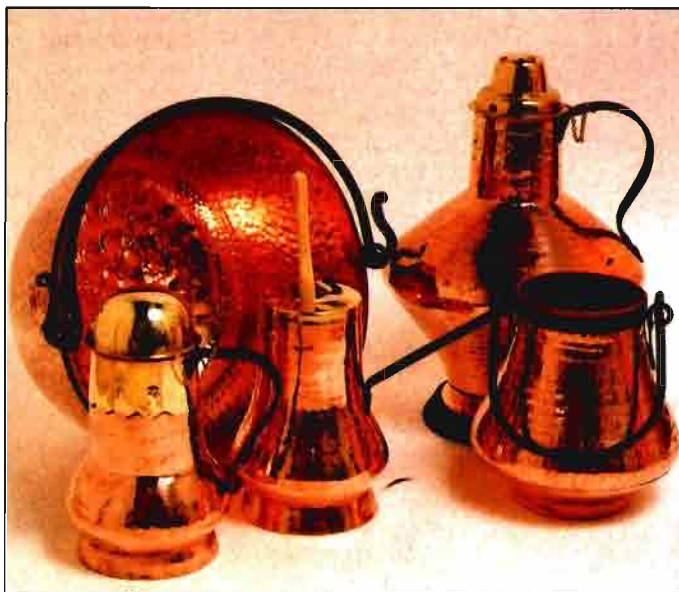
Calderería de Guadalupe, famosa desde el siglo XV.