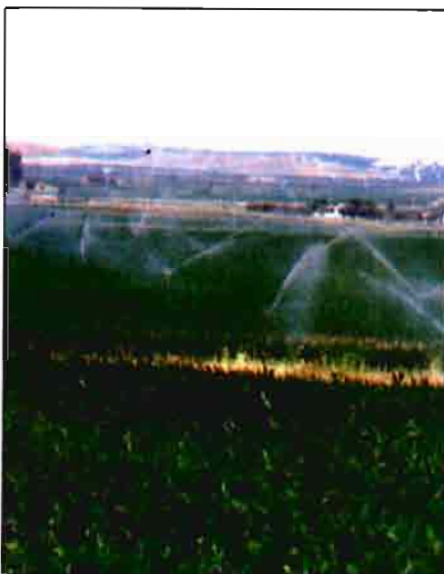
Regadíos del Valle del Jerte.

El segundo aspecto fundamental a destacar es que varía la tipología de las ayudas eliminando las ayudas directas sobre la inversión, salvo en el caso de la prima de incorporación de jóvenes agricultores, y concentrando la acción en la subsidia-