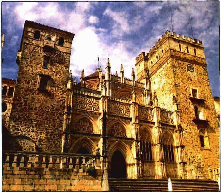
Monasterio de Guadalupe.