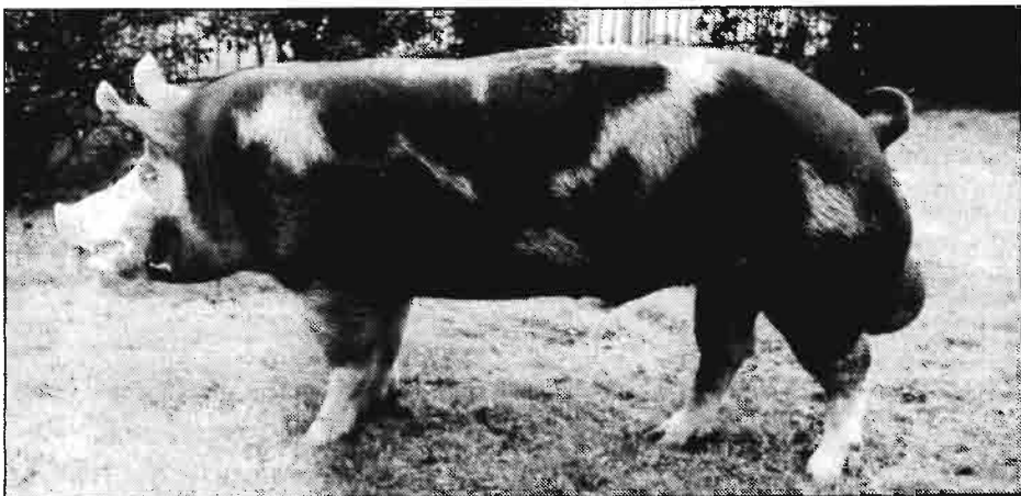
Cerdo de raza Pietrain.

Desde principios de Noviembre se ha registrado en el mercado de porcino una mejoría sensible de la situación, no sólo en España sino en los países comunitarios que más preocupan a los porcicultores españoles. La oferta es actualmente inferior a la demanda y no hay peligro inmediato de que los cerdos de abasto se pasen de peso. A mediados de Noviembre la carne de porcino se situaba en torno de las 160 pta/kg vivo, equivalente a unas 210 pta/kg canal, con tendencia alcista. Lechones a 4.500 pta/unidad con 14-15 kg en vivo.