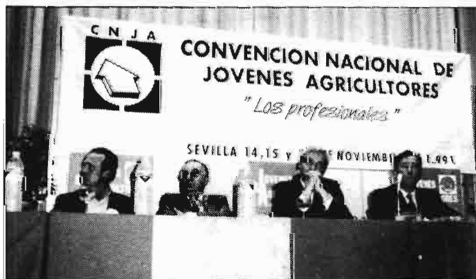
Los Jóvenes Agricultores también tuvieron presencia activa en AGROMEDITERRANEA '91 de Sevilla, celebrando una Convención Nacional, a la que asistió el Consejero de Agricultura y Pesca de la Junta de Andalucía, Leocadio Marín, y en la que se debatió la reforma de la PAC y se dió a conocer la opinión al respecto del CNJA.

Por su parte los precios del trigo blando panificable —pese a que han entrado del exterior en lo que va de campaña cerca de 250.000 toneladas (175.000 más que en el mismo periodo de la anterior)— muestran una clara tendencia alcista en todas las regiones productoras. Se vende el trigo blando en origen entre 27 pta/kg en Castilla-León y 29 pta en Castilla-La Mancha, quedando en medio Andalucía con 28 pta/kg. Sobre muelle de harinera se paga entre 29 y 34 pta/kg, según calidades y propiedades mejorantes del producto.