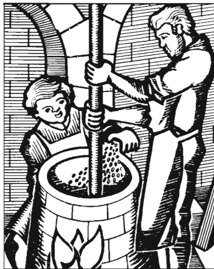
Ilustración del folleto divulgador, a color, del Consejo Regulador de la Denominación de Origen Jijona.

(*) Francia, Argelia, Túnez, Gaza, EE.UU. Fuente: CLAM