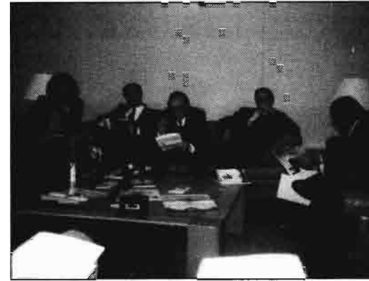
La organización itálica Agri Cesena presentó en Sevilla, en el marco de AGROMEDITERRANEA '91 las ferias Macfrut, Trans Wold y Agro-Bio frut que se celebrarán en Italia en 1992.