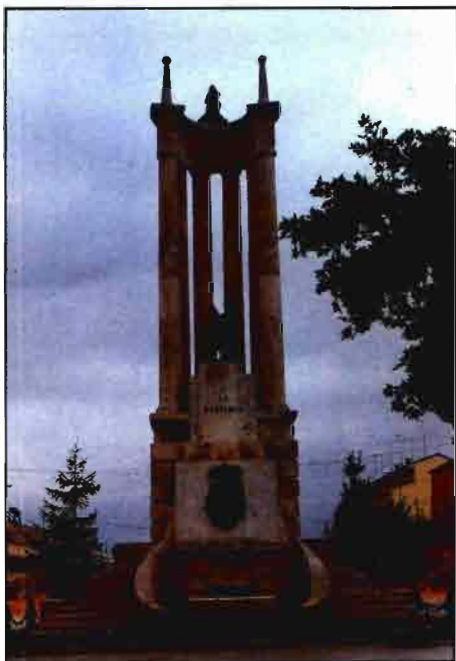
REQUENA (Valencia). Monumento Nacional a la Vendimia Española.