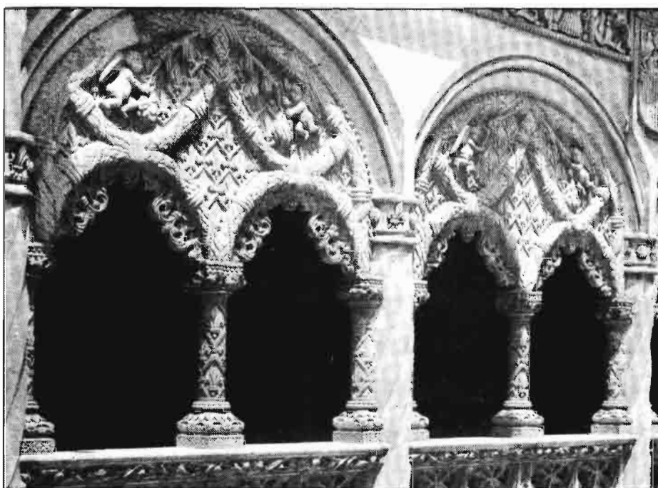
San Gregorio. Valladolid.

— La Renta por ocupado en precios corrientes experimenta un aumento debido al comportamiento de la Producción Final Agraria y al descenso del número de ocupados en el sector (—6,5%). En términos reales la renta se ha situado al mismo nivel que el alcanzado en 1988.