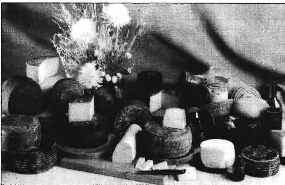
Quesos de Castilla y León.

—Establecimiento de medidas que favorezcan la extensificación de los cultivos, el abandono de la producción y el cese anticipado de la actividad agraria.