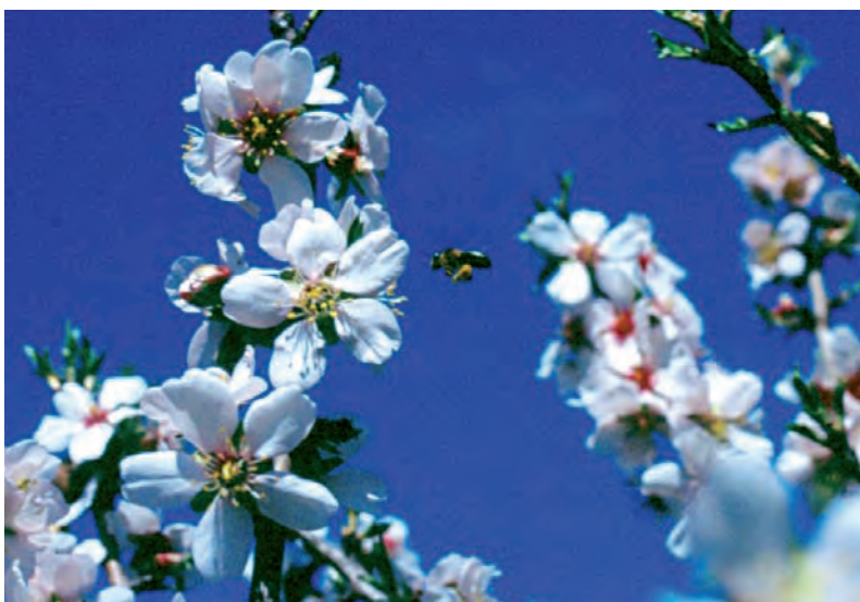
Foto 2. Abeja en el proceso de la polinización del almendro.