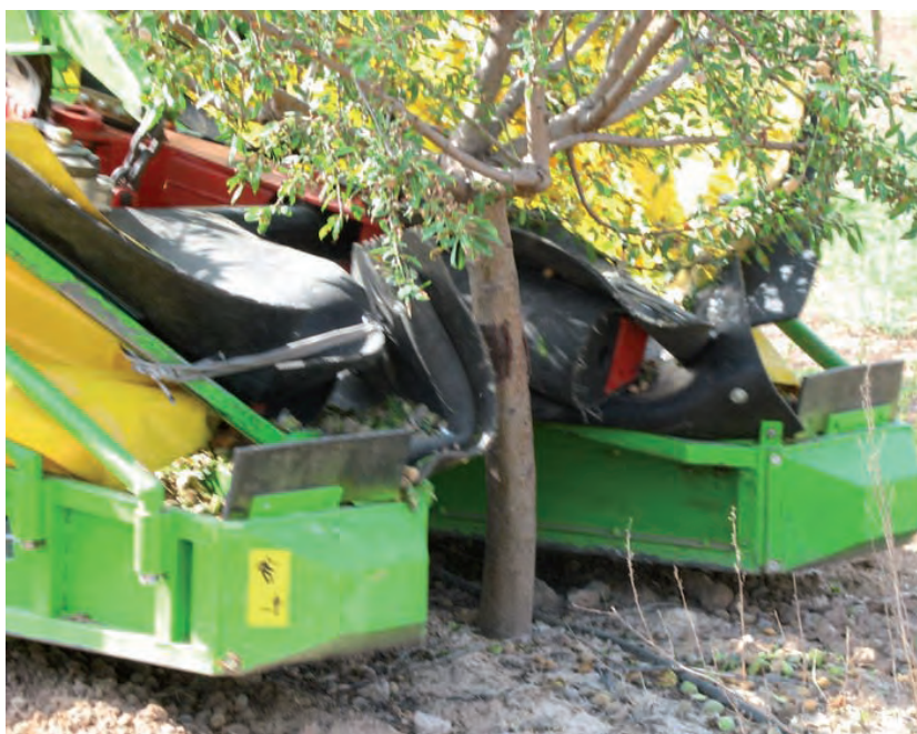
Foto 3. Vibrado del tronco durante la recolección

Para evitar los inconvenientes de las lluvias en el momento de la recolección también se ha considerado la estrategia de adelantar la fecha de esta operación, de la misma forma que se ha planteado retrasar la fecha de floración para evitar las heladas. Así, si se adelanta la fecha de la recolección, ésta transcurre en días más largos y más cálidos, con lo cual se puede intensificar el trabajo y al mismo tiempo se produce el secado mucho más rápido de los frutos, mien-