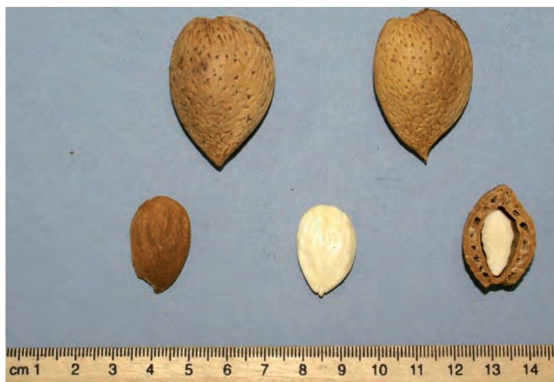
Foto 1. Frutos de 'Mardía'

una densidad floral eficiente y regular, una polinización autógama (se produce la fecundación de las flores con su propio polen), un cuajado elevado, la tolerancia a enfermedades, la cáscara dura y un tamaño de pepita medio a grande, con una calidad industrial muy elevada debido a que el contenido en ácido oleico de la pepita es muy alto, mientras que el del ácido linoleico es bajo. Igualmente se ha comprobado su buen comportamiento vegetativo en condiciones de secano, aunque evidentemente su producción se ve afectada por la falta de la suficiente dotación de agua. Por otra parte, aunque su época de maduración es temprana, es posterior a la de 'Guara', lo que puede permitir un escalonamiento de la recolección en aquellas explotaciones en las que se hayan plantado ambas variedades, lo que permite una mejor planificación de las labores de la cosecha y un mejor aprovechamiento de la maquinaria de recolección por su utilización durante un mayor período de tiempo.