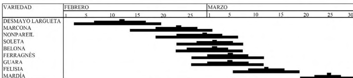
Gráfico 1. Fecha de floración (media de 7 años en Zaragoza) de algunas variedades de almendro.

Por otra parte, el almendro es probablemente la especie con una época de floración más alargada cuando se tienen en cuenta todas sus variedades. Las variedades de floración tardía presentan el interés de que su época de floración puede transcurrir cuando ya se han superado las fechas de mayor peligro de heladas, así como en fechas con unas temperaturas