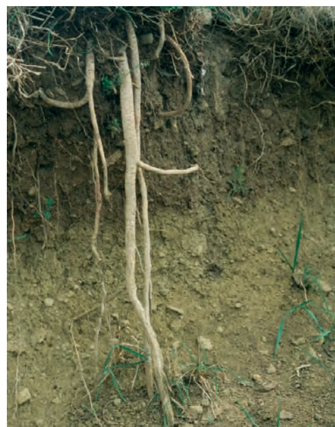
Raíz pivotante de la mielga