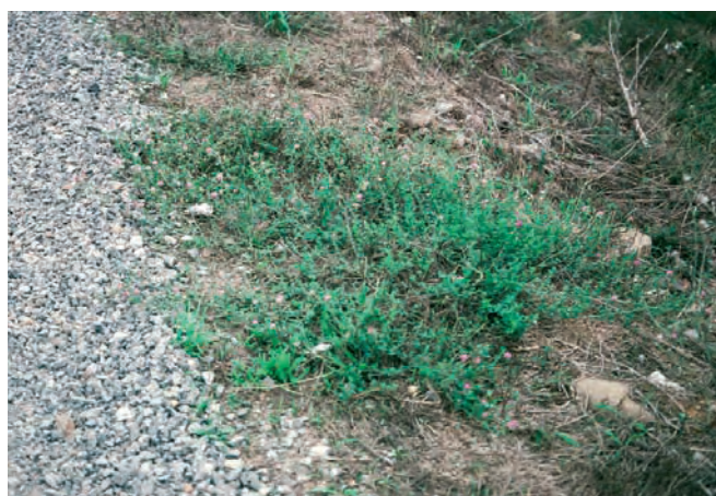
Mielga creciendo en la cuneta

Esta capacidad que presenta la mielga para emitir rizomas es una cualidad medioambiental, ya que le posibilita para colonizar mayor superficie de suelo y preservarlo de la erosión. En el ensayo llevado a cabo en Teruel, se apreció que al final de los cinco años, las