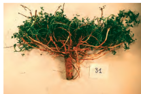
Anchura de la corona de la mielga

Mediterráneo se secó parcialmente, posibilitando la invasión de especies vegetales procedentes de Asia que, al reabrirse de nuevo el Estrecho, quedaron aisladas en la península Ibérica.