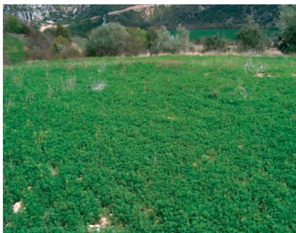
Establecimiento de un campo de mielgas en el Prepirineo

Diversos trabajos realizados sobre su valor agronómico muestran que la producción de forraje de la mielga es inferior a la de la alfalfa cultivada. En el ensayo llevado a cabo en Teruel durante 5 años (Delgado, 1995), a 900 m de altitud, precipitación anual media de 473 mm y temperaturas mínimas extremas de hasta -13^{\circ}\text{C} , la mielga presentó una producción media anual de 2125 kg de materia seca por hectárea, cifra significativamente inferior a la obtenida con las alfalfas cultivadas erectas, las cuales alcanzaron una media de 3977 kg/ha.