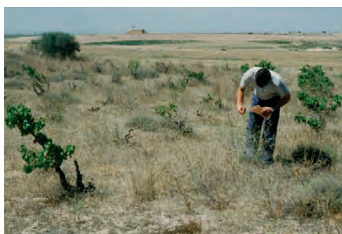
Recolección de semilla en campos abandonados

Estas diferencias contribuyen a pensar que las mielgas no son alfalfas “escapadas” de un alfalfar