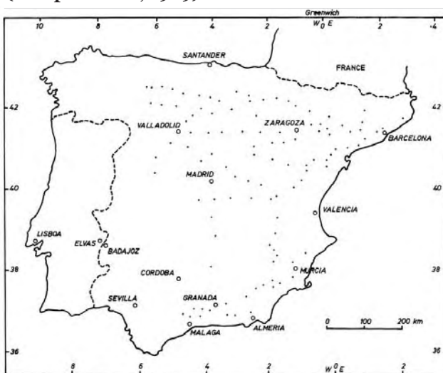
Figura 1: Localización de las mielgas prospectadas (Prosperi et al. , 1989)

Estas diferencias contribuyen a pensar que las mielgas no son alfalfas “escapadas” de un alfalfar