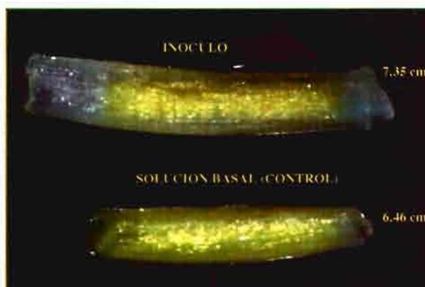
Figura 3 Imagen de coleóptilo expuesto al inóculo de bacterias fijadoras de nitrógeno (producto Azobac) (coleóptilo superior) en comparación con el expuesto a la disolución basal (coleóptilo inferior)

Como puede observarse en la Figura 3 , en este ensayo se pudo detectar un efecto fitohormonal tipo auxina, obteniéndose una mayor elongación en los segmentos