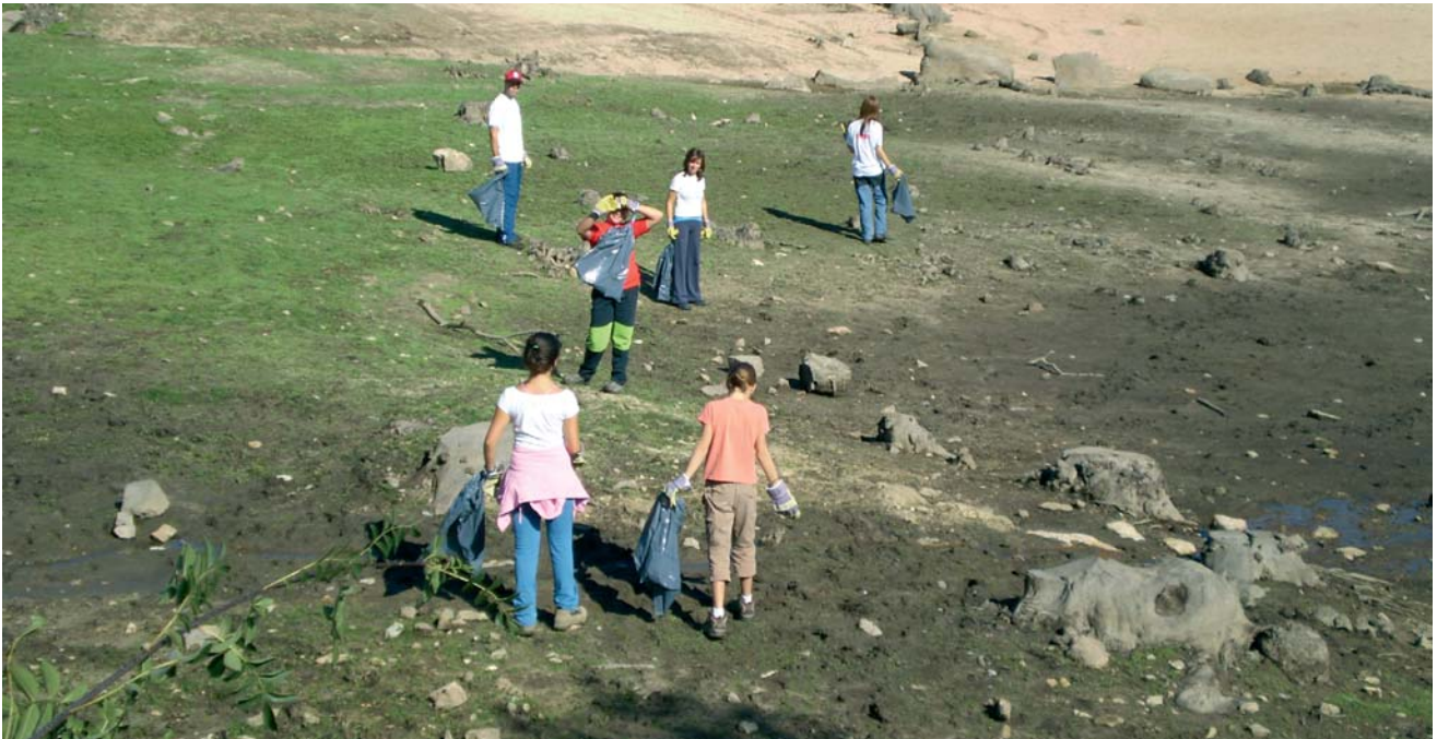
El voluntariado es una de las formas más completas de participación social en defensa del medio.

Toda la información necesaria para poder participar puede encontrarse en la dirección de Internet: http://www.adecagua.org/monitoring.htm