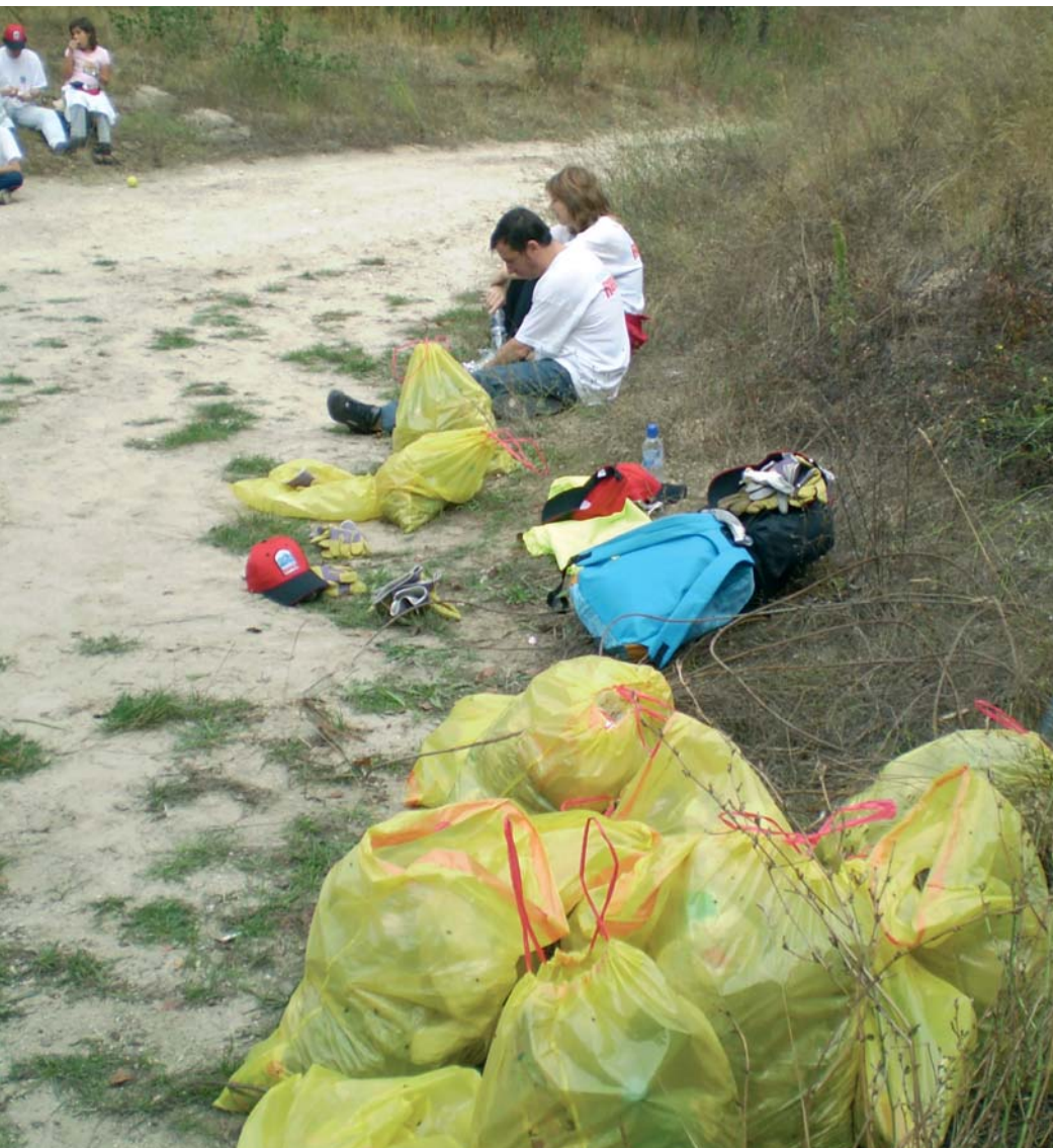
Existen numerosas organizaciones que realizan actuaciones con voluntarios sobre los ríos.

Todos somos responsables en la conservación del medio ambiente. En este sentido, el voluntariado es una oportunidad para implicar a la sociedad de una manera activa en la resolución de los problemas. La ex-