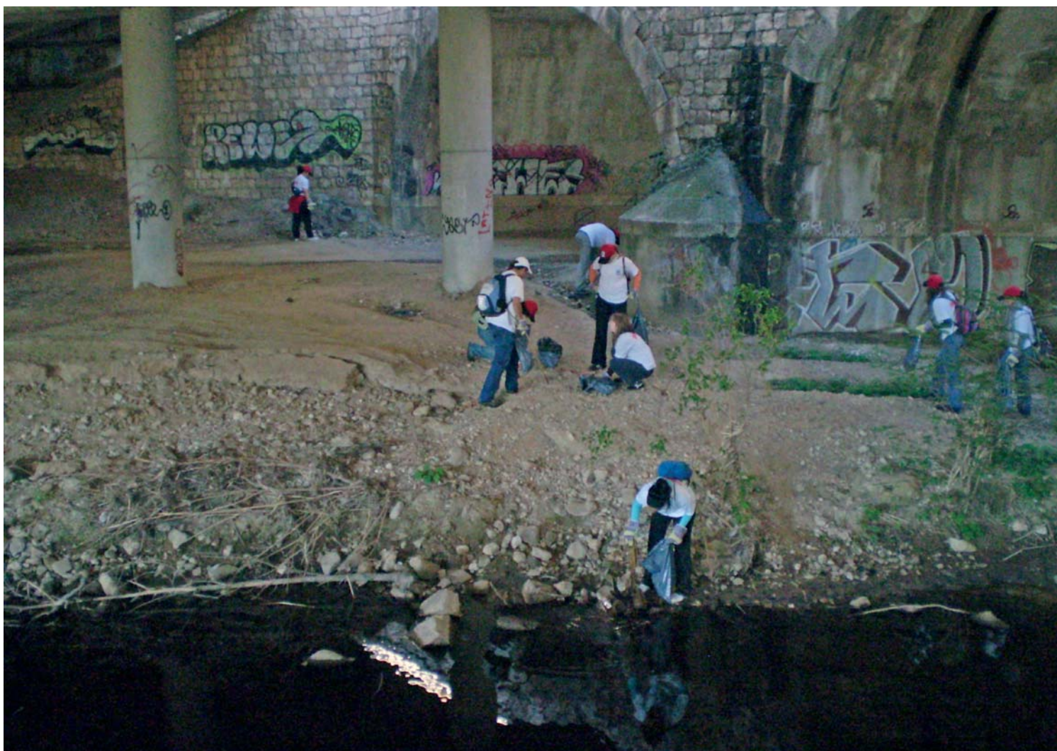
El voluntariado es una oportunidad para implicar a la sociedad de una manera activa en la resolución de los problemas.

“Por ejemplo”, continúa Ramírez, “el pasado mes de julio celebramos el ‘Big Jump’ en ocho ríos de la geogra-