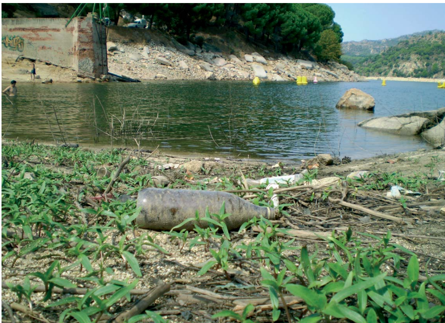
La promoción de actividades de voluntariado difunde un mayor conocimiento del medio fluvial al acercar a la sociedad las dificultades que afrontan nuestros ríos.