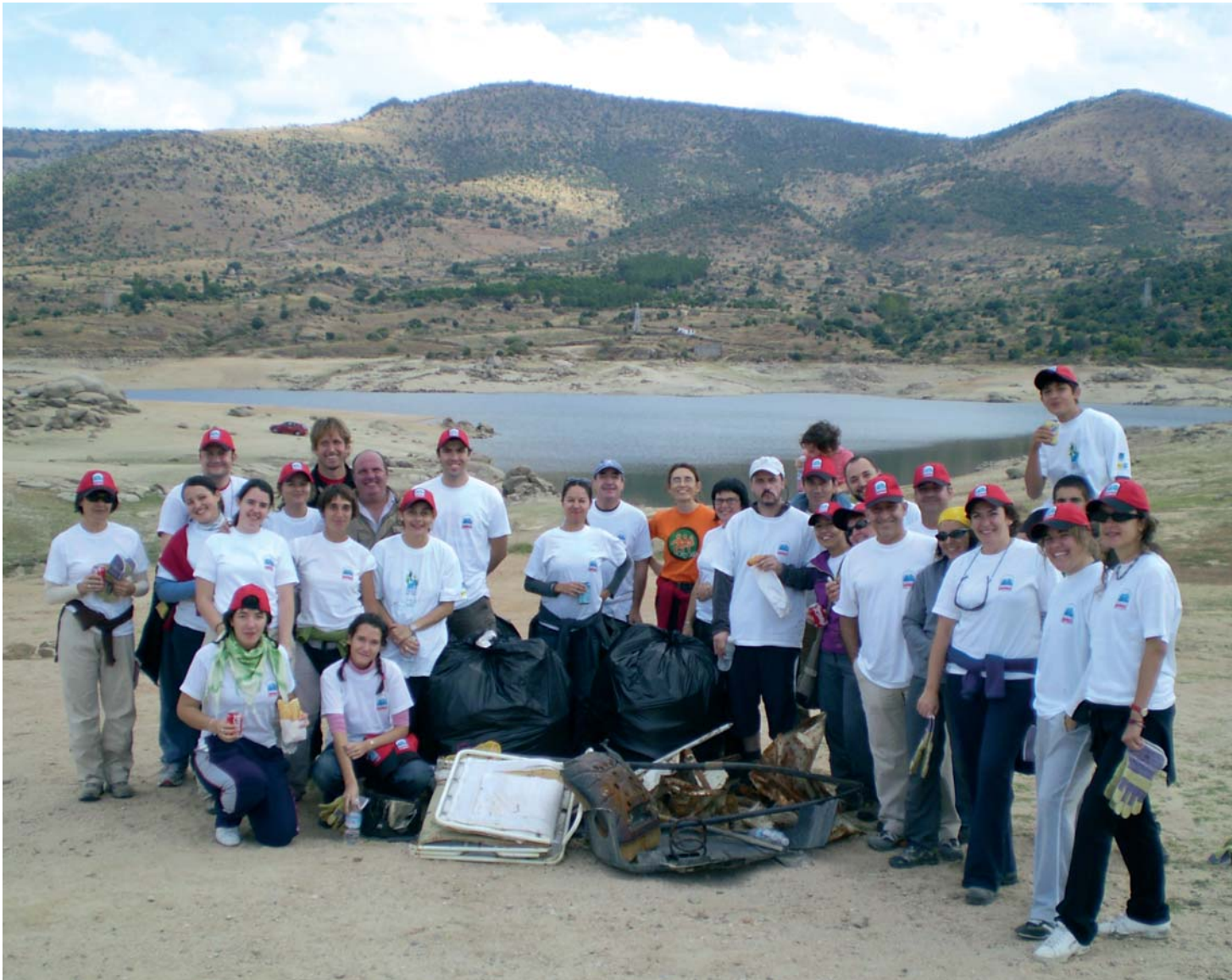
Los voluntarios son un estupendo medio de difusión de todo lo que aprenden en las actividades que se organizan.

el entorno natural, de modo que se genere en las personas conciencia de su capacidad de intervención en la resolución de los problemas ambientales.