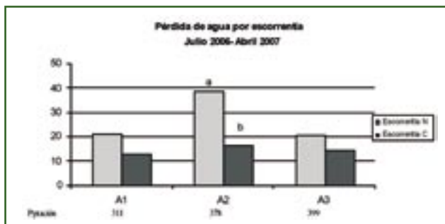
Figura 2. Precipitación (mm) y Pérdida de agua por escorrentía. N: laboreo convencional. C: cubierta vegetal. Letras distintas en una misma parcela indican diferencias significativas

Por otra parte, y aunque los resultados no han sido signi-