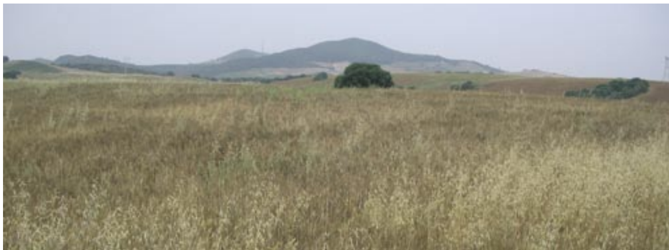
Foto 2. Cultivo de trigo infestado por avena loca.