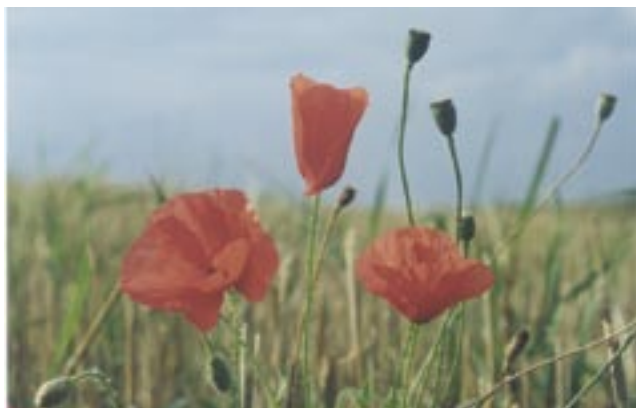
Foto 1. La amapola ( Papaver rhoeas . L.) es una mala hierba que puede afectar a los cereales de invierno.

de gramíneas anuales y perennes como de dicotiledóneas. Es así que se generalizaron las combinaciones de glifosato con herbicidas residuales del tipo de las triazolpirimidinas e imidazolinonas durante el barbecho previo a la siembra de soja hacia finales de la década del 80 y sobre todo del 90, en combinación o no con herbicidas de postemergencia después de la siembra del cultivo. Pero la difusión masiva de cultivares RR a partir de 1995-96 cambió radicalmente el panorama y al cabo de dos años, la utilización de los herbicidas “convencionales” decayó drásticamente como consecuencia del menor coste de los tratamientos con glifosato (Leguizamón, 2001, 2004).