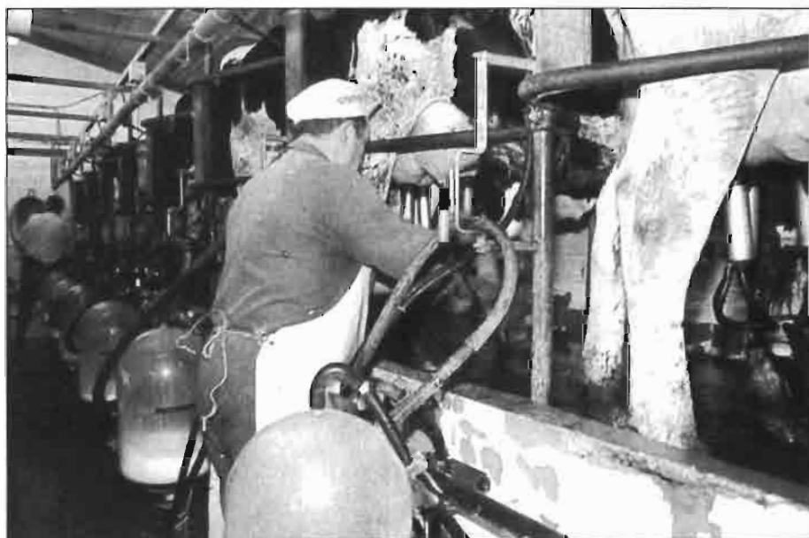
La situación del mercado mundial de leche se ha caracterizado en los últimos años por un incremento pequeño de la producción.

Estas ayudas supusieron en 1993 casi 5.300 millones de Ecu, un 15% del total de gastos de la sección "Garantía" del FEOGA. Aunque esta cantidad puede parecer que es muy elevada, y lo es, no se puede ignorar aquí que la UE contribuye con un 32% a las exportaciones mundiales de leche, con un 38% a las de mantequilla, con un 52% a las