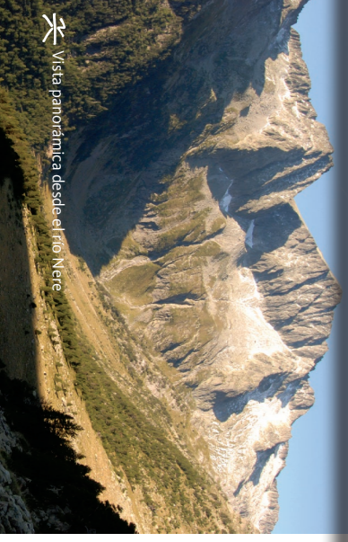
Vista panorámica desde el río Nere

Finalmente en 1948, tras superar un desnivel de 200 m y alcanzar una longitud total de 5 km de largo, el túnel estuvo terminado. Los araneses siguieron empleando el Camino del Port de Vielha para comerciar sus productos con el resto de la Península.