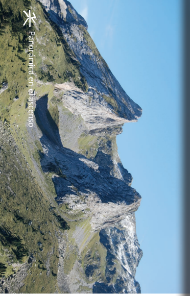
Panorámica en el ascenso