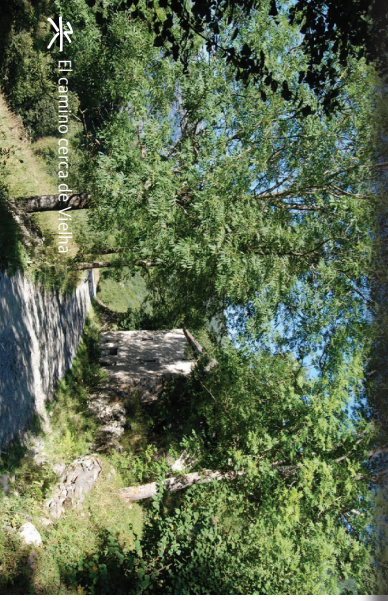
El camino cerca de Vielha