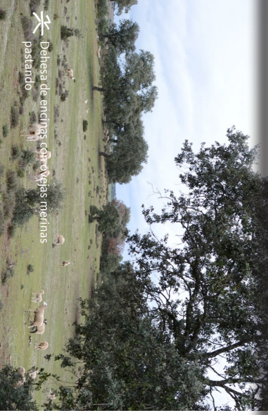
Dehesa de encinas con ovejas merinas pastando