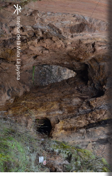
Interior de la Mina La Jayona

La principal riqueza del Monumento Natural, sin embargo, es geológica, destacando un gran espejo de falla, pliegues, mineralizaciones de hierro y procesos kársticos, visibles desde los varios niveles de los pozos excavados por los mineros. La mina es visitable de martes a domingo, en dos turnos a las 10:00 y a las 12:00, y la visita es gratuita. (mail de contacto: ci.minajayona@gobex.es )