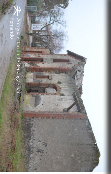
Antigua estación de Berlanga - San Fernando