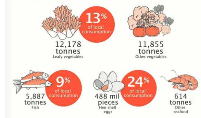
Local farm production of key food items

Producción local de Singapur de determinados productos esenciales en 2018.