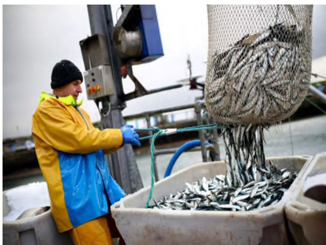
Imagen: Ministerio británico de Medio Ambiente, Alimentación y Asuntos Rurales

En virtud del acuerdo Brexit alcanzado entre Reino Unido y la UE, en materia de pesca, los barcos de la UE continuarán pescando en aguas del Reino Unido durante algunos años, pero los británicos obtendrán una mayor parte de las capturas de las aguas del Reino Unido. Ese cambio en la cuota se hará de forma gradual entre 2021 y 2026, siendo la mayor parte de esta transferida en 2021. Tras dicho período habrá negociaciones anuales para decidir el reparto de capturas entre el Reino Unido y la UE, y el primero tendría derecho a excluir completamente a los barcos de la UE. No obstante, la UE podría responder con impuestos a las exportaciones de pescado británico al bloque o negando a los barcos británicos el acceso a sus aguas.