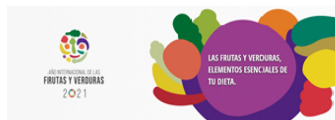
Logo del Año Internacional de las Frutas y Verduras 2021

Para España, la celebración del AIFV recobra especial importancia dado nuestro carácter como uno de los principales productores hortofrutícolas europeos y mundiales, cuyas producciones gozan de los más altos estándares de calidad y reconocimiento mundial, además del carácter central que las mismas ocupan en la Dieta Mediterránea. La celebración del AIFV permitirá además reforzar la visibilidad de los pequeños productores y su papel fundamental en nuestros sistemas alimentarios.