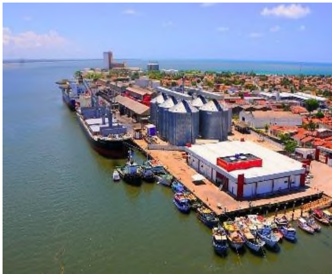
Terminal Pesqueiro de Cabedelo

El nuevo Decreto modifica el Decreto No 5.231 de 2004 y entra en vigor en la fecha de publicación.