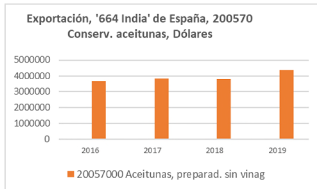
Exportación de aceitunas de España a la India (2016-2019; valor en USD). Fuente: Datacomex. Elaboración: MAPA

La importación total de aceitunas a la India del resto del mundo alcanzó un valor de 4,39 M USD entre abril y diciembre de 2019, un 5,8% por encima del total del periodo anual del 01.04.2018 al 31.03.2019 (4,15 M USD). El primer exportador fue España, por un valor del 90,9% del total del producto importado por la India entre abril y diciembre de 2019, y del 83,6% en el periodo 01.04.2018 a 31.03.2019. En la actualidad, junto con las procedentes de España, constan exportaciones de aceituna a la India de Egipto, Portugal, Marruecos, Grecia, Turquía, Italia, Reino Unido, China, Emiratos Árabes Unidos, Singapur y Países Bajos. El valor total de las exportaciones del producto del conjunto de dichos países fue de 0,68 M USD del 01.04.2018 al 31.03.2019, y de 0,40 M USD entre abril y diciembre de 2019.