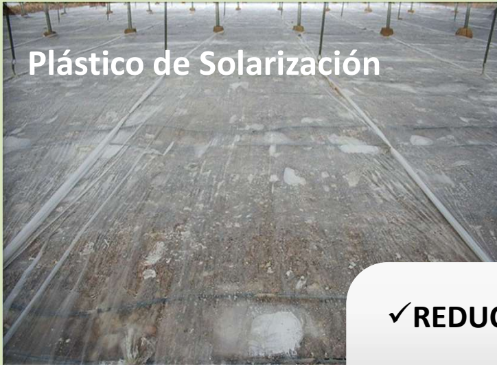
Plástico de Solarización