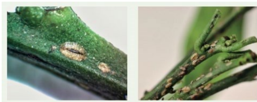
Figura 1. Hembras inmaduras de Pulvinaria polygonata con quilla longitudinal. Generalitat Valenciana, 2019.