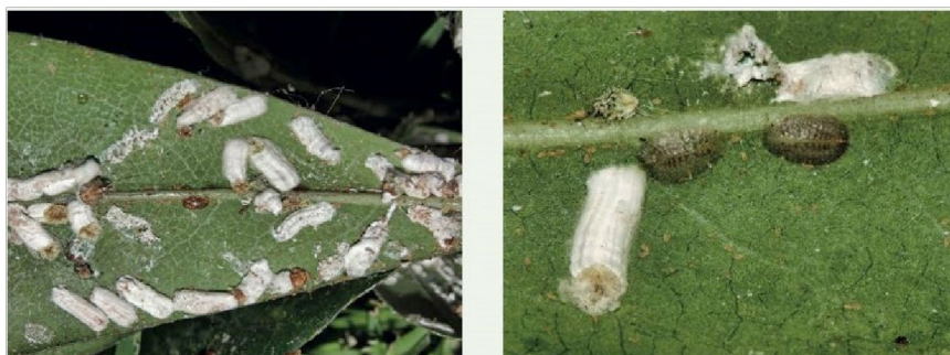
Figura 3: Hembra adulta de Pulvinaria floccifera con el ovisaco para la colocación de huevos totalmente formado