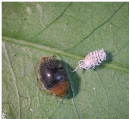
Figura 6: Adulto y larva de Cryptolaemus montrouzieri . Generalitat Valenciana.

Cryptolaemus montrouzieri ( Figura 6 ) es un depredador que se utiliza frecuentemente en el mediterráneo para el control del cotonet ( Planococcus citri ) en los cítricos, y que también se alimenta de otras cochinillas. Por todo ello, el control biológico en parcelas con presencia de Pulvinaria polygonata , se debe basar en conservar las poblaciones naturales de Cryptolaemus montrouzieri , mediante la aplicación de tratamientos químicos respetuosos con la fauna auxiliar, como el aceite de parafina, e introducir poblaciones de este coccinélido procedentes de laboratorio si fuera necesario.