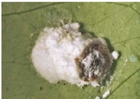
Figura 1: Hembra adulta de P. polygonata con el ovisaco para la colocación de huevos totalmente formado. Generalitat Valenciana, 2019.

Por su parte, Pulvinaria polygonata ( Figura 1 ) se localiza únicamente en algunos países del Sur de Asia y Oceanía, aunque parece que su distribución no está clara y que se trata de una plaga en expansión.