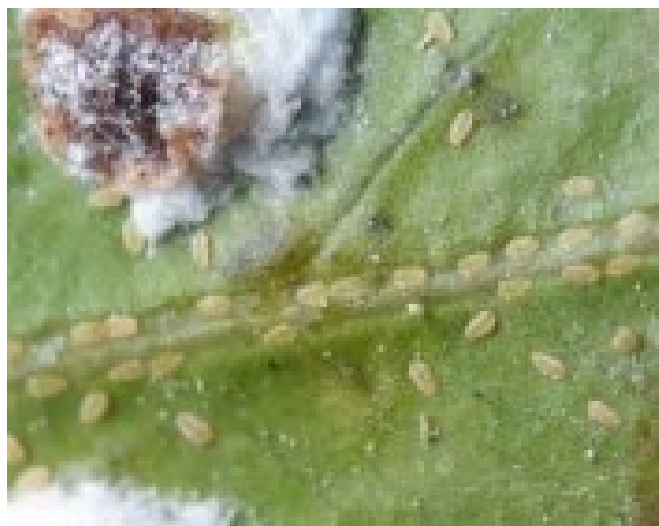
Figura 4. Detalle de larvas de Pulvinaria polygonata distribuyéndose por una rama para su alimentación. Generalitat Valenciana.