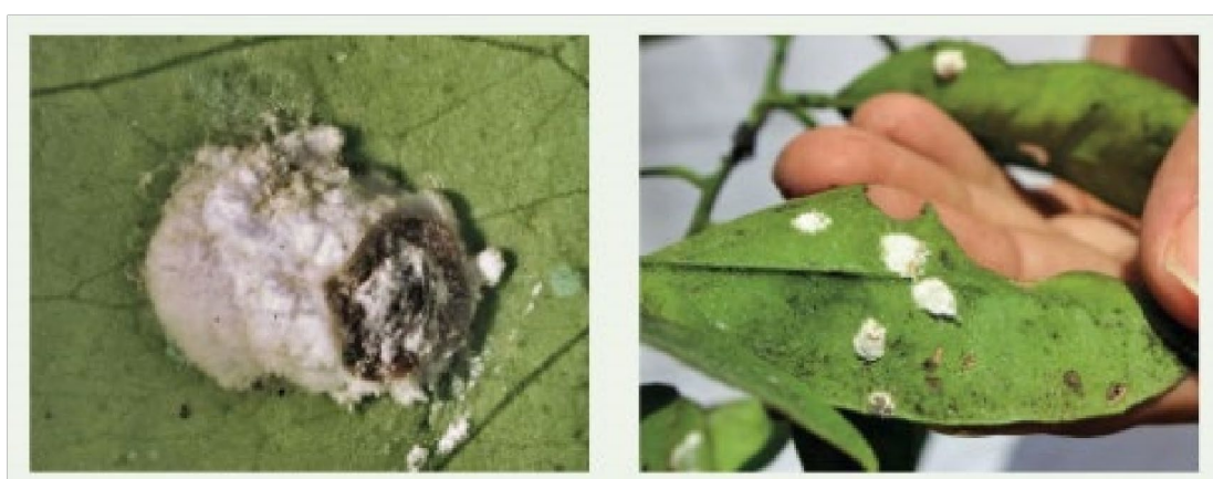
Figura 2. Hembras adultas de Pulvinaria polygonata con ovisaco. Generalitat Valenciana, 2019.