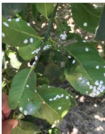
Figura 3. Detalle de rama infestada por Pulvinaria polygonata .