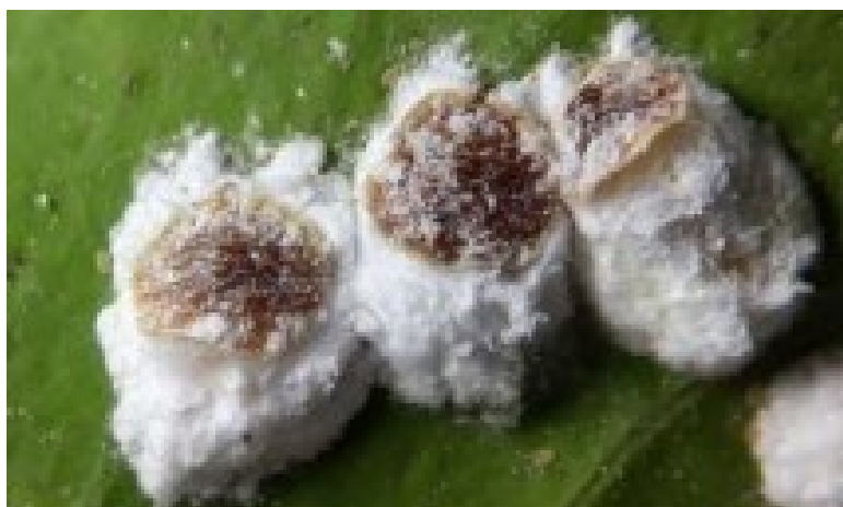
Figura 5. Detalle de rama infestada por Pulvinaria polygonata . Generalitat Valenciana, 2019.