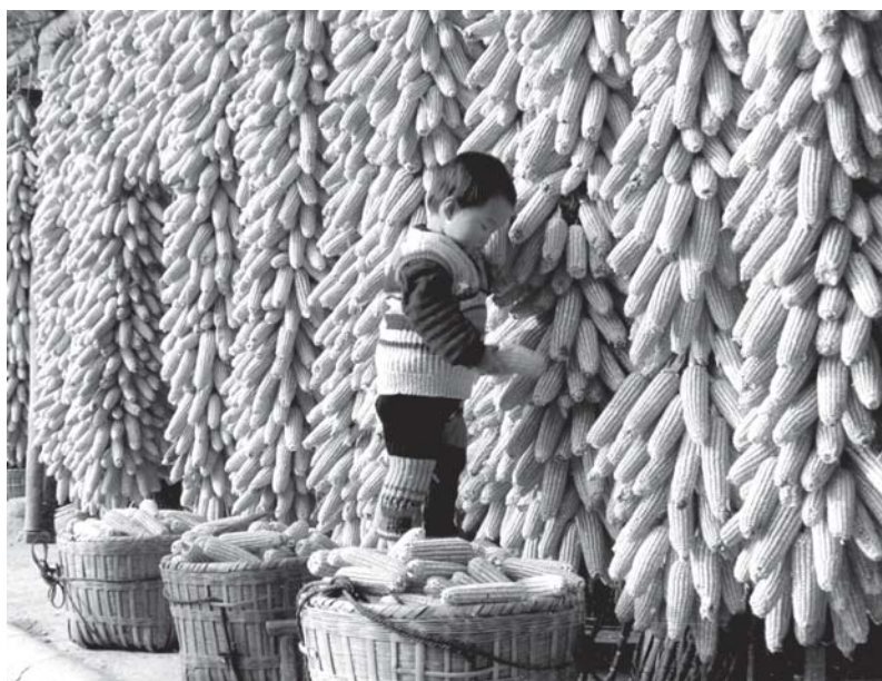
EL PROTOCOLO EXHORTA A LA TRANSFERENCIA, MANIPULACIÓN Y UTILIZACIÓN SEGURAS DE LOS ORGANISMOS VIVOS MODIFICADOS Y DESTACA ESPECÍFICAMENTE LA NECESIDAD DE SENSIBILIZACIÓN Y EDUCACIÓN PÚBLICAS.

Las actividades en favor de la seguridad de la biotecnología en el marco del Protocolo de Cartagena reúnen los requisitos para recibir apoyo del Fondo para el Medio Ambiente Mundial, fondo internacional que fue establecido para ayudar a los países en desarrollo a proteger el medio ambiente mundial. Se espera que también los gobiernos promuevan la participación del sector privado en la creación de capacidad.