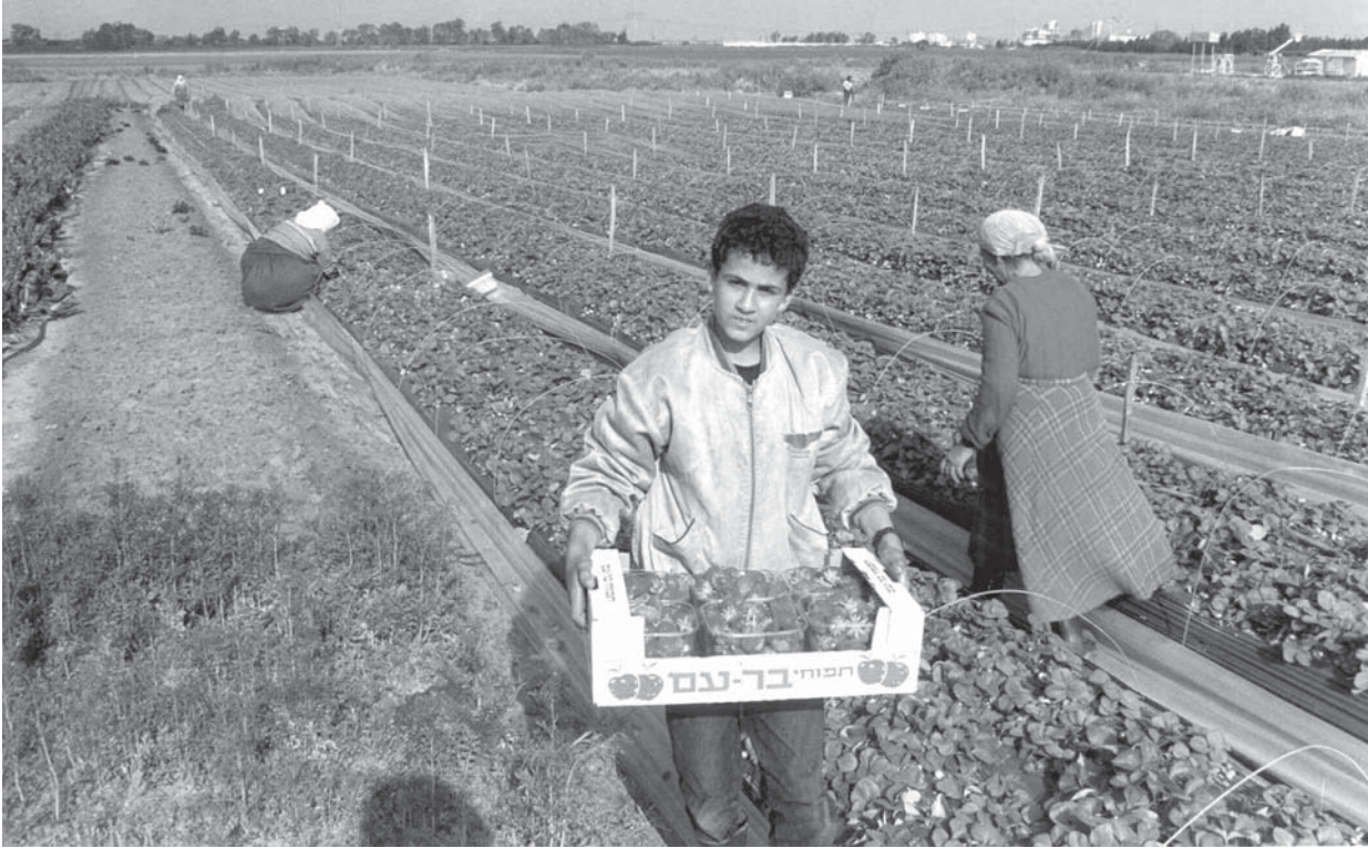
LOS PROCEDIMIENTOS MÁS RIGUROSOS EN MATERIA DE SEGURIDAD DE LA BIOTECNOLOGÍA ATAÑEN A LOS OGM QUE SE TIENE LA INTENCIÓN DE INTRODUCIR EN EL MEDIO AMBIENTE.

otros OGM del procedimiento del acuerdo fundamentado previo.