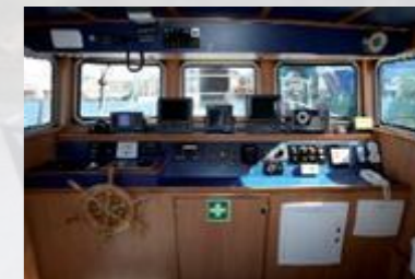
Intérieur du bateau auxiliaire