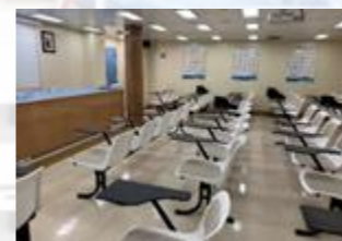
Salle de cours