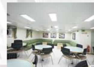
Salle des élèves