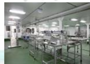
Parc de pêche