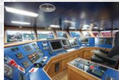
Passerelle de navigation

D'autre part, les élèves de la Marine Espagnole peuvent améliorer la formation pratique et théorique reçue dans les domaines de la navigation, de la manœuvre, des systèmes de communications, de la propulsion navale etc. pour acquérir les compétences nécessaires pour accomplir leur mission.