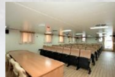
Salle de réception