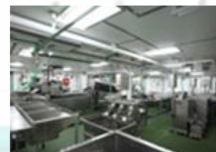
Parc de pêche