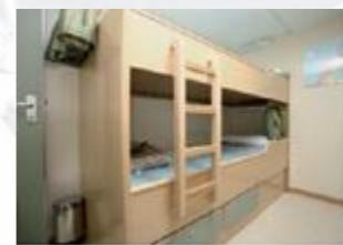
Cabine des élèves