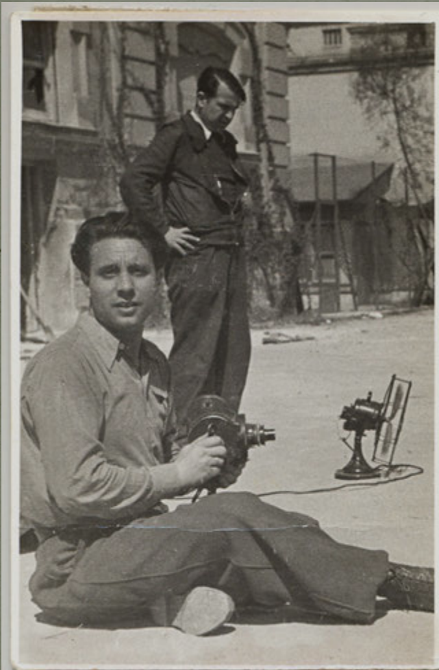
Reportero de Guerra