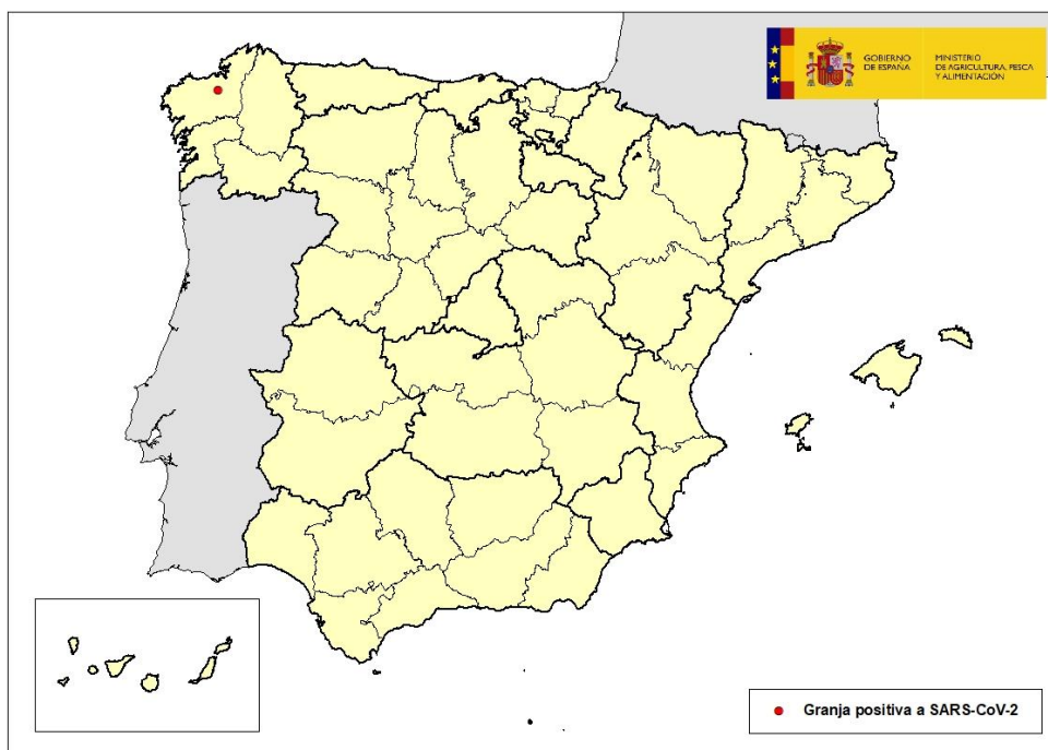
Mapa 1: localización de la granja afectada por SARS-CoV-2 en Abegondo, A Coruña, Galicia

La explotación afectada se localiza en el municipio de Abegondo y cuenta con un censo de 8.760 animales (1.760 hembras reproductoras y 7.000 crías). La detección ha sido posible gracias a la vigilancia activa contemplada en el Programa de Prevención, Vigilancia y Control de SARS-CoV-2 en granjas de visón americano, elaborado por el MAPA en colaboración con el Ministerio de Sanidad (CCAES), obteniéndose resultado positivo por PCR-RT en una de las muestras de hisopos orofaríngeos enviadas al LCV de Algete.