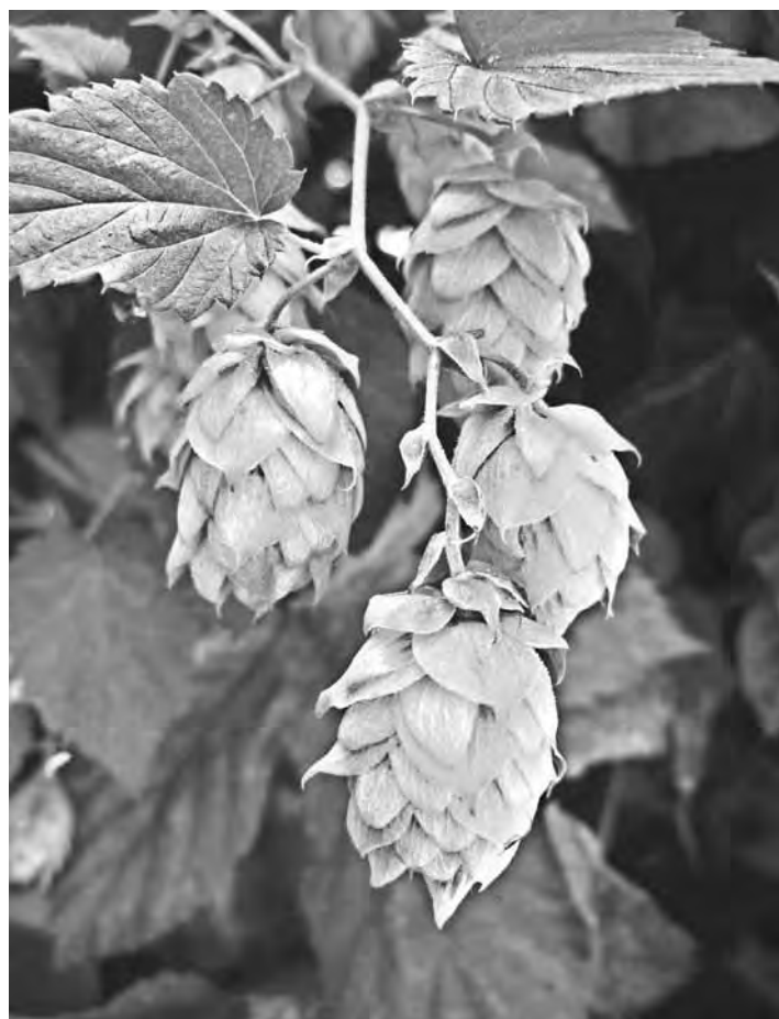
Cuadro 1. Porcentajes de subvención de cada grupo de líneas de seguro