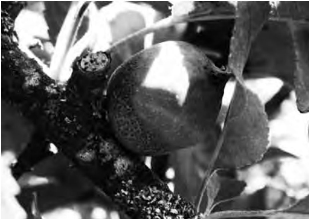
Daño por helada sobre manzana.