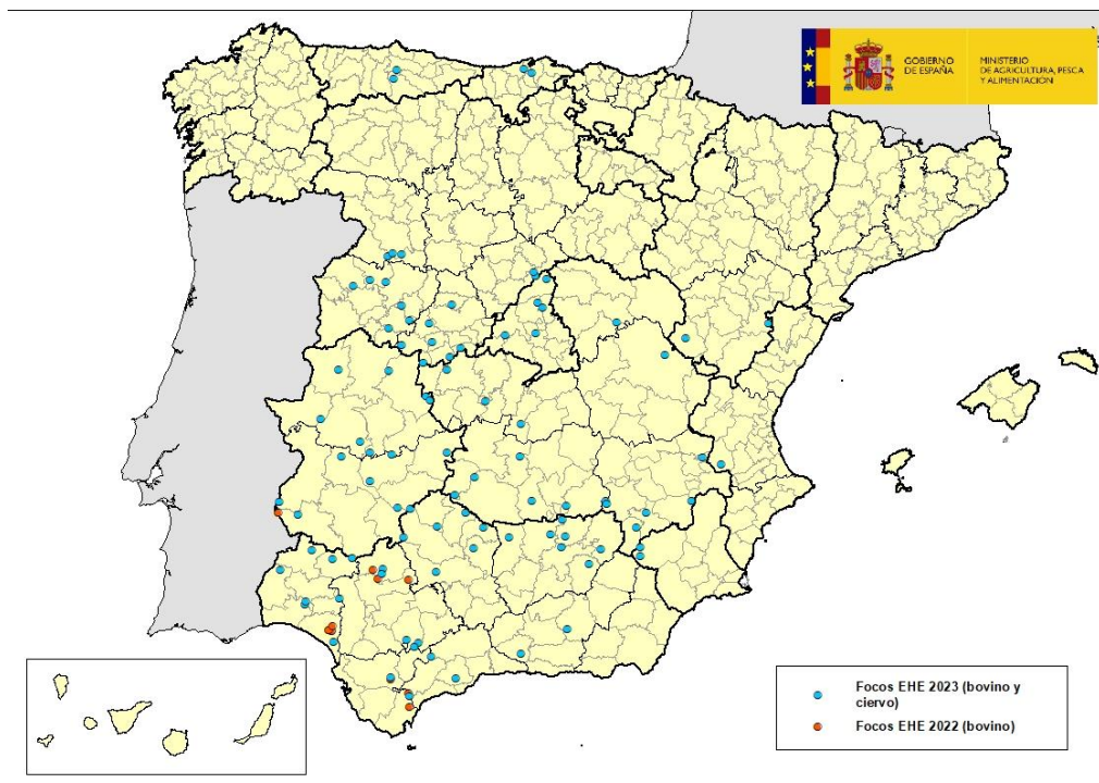
Mapa 1: Focos de EHE en España en años 2022 y 2023

Desde la última actualización sobre la enfermedad realizada el pasado 29 de agosto, el Laboratorio Central de Veterinaria (LCV) de Algete, laboratorio nacional de referencia para esta enfermedad, ha confirmado 18 nuevos casos de enfermedad hemorrágica epizootica (EHE), 16 de ellos en explotaciones de bovino en las comarcas de Siero y Lena (Asturias); Solares-Medio Cudeyo y Torrelavega (Cantabria); Riaza (provincia de Segovia); Vitigudino y Salamanca (provincia de Salamanca); San Pedro del Arroyo, Sotillo de la Adrada y Navarredonda de Gredos (provincia de Ávila); El Escorial y Torrelaguna (provincia de Madrid); Cantavieja (provincia de Teruel); Hellín (provincia de Albacete); Guadalajara (provincia de Guadalajara); y Guadix (provincia de Granada). Además, 2 de los casos se han confirmado en ciervos silvestres en las comarcas de Madrid C.U. (provincia de Madrid) y Albarracín (provincia de Teruel). Ver mapa 1.