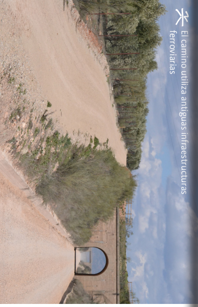
El camino utiliza antiguas infraestructuras ferroviarias