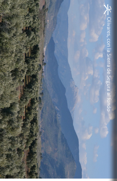
Olivares, con la Sierra de Segura al fondo

El camino natural discurre en su totalidad por la Comarca de Sierra de Segura, que conforma el 70% de la superficie del Parque Natural de las Sierras de Cazorla, Segura y Las Villas. Este Parque Natural es el mayor espacio protegido de España. La UNESCO declaró al conjunto montañoso Reserva de la Biosfera en 1983, y la Unión Europea también considera a estas sierras como un espacio natural privilegiado, declarándolo ZEPA (Zona de Especial Protección para las Aves) en 1988 y LIC (Lugar de Importancia Comunitaria) en 2006, pasando a formar parte de la Red Natura 2000.