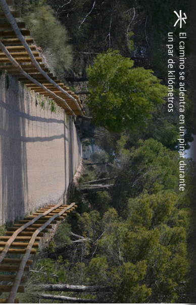
El camino se adentra en un pínar durante un par de kilómetros