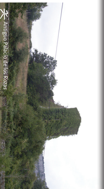
Antiguo Palacio de los Rozas

Además, la población se encuentra rodeada por una gran muralla que fue construida con fines militares. De hecho, dicha muralla es uno de los monumentos más importantes del legado histórico de la localidad. La Casa Palacio de los Porras, construida a finales del siglo XV, y la iglesia de San Pelayo se suman a los monumentos más destacados de la zona.