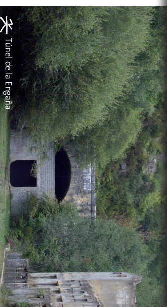
Túnel de la Engaña