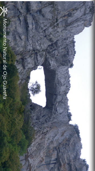
Monumento Natural de Ojo Guareña