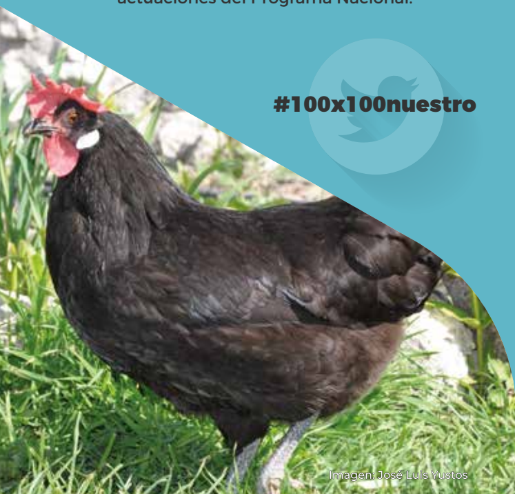
Imagen: José Luis Yustos